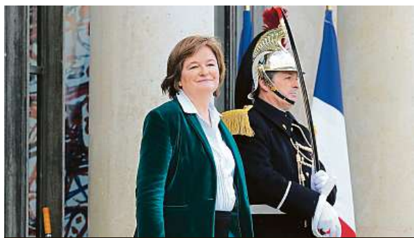
Ministryně Nathalie Loiseauová

„Začala jsem svému kocourovi říkat Brexit. Každé ráno mě vzbudí mňoukáním, protože chce ven z pokoje. Když mu otevřu, zůstane nerozhodně ve dveřích. Když ho dám