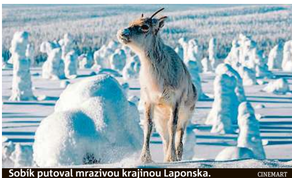
Sobík putoval mrazivou krajinou Laponska.

Film Putování se sobíkem bude v kiněch už od zítřka.