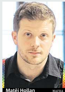
Matěj Hollan MAFRA