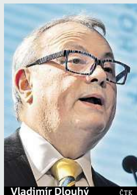
Vladimír Dlouhý