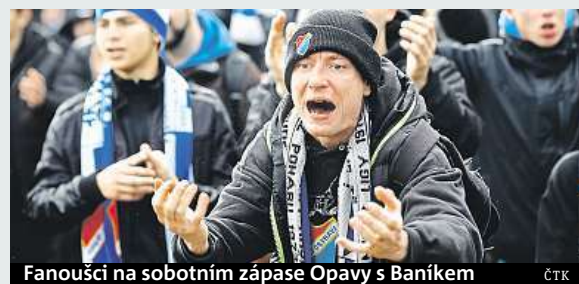
Fanoušci na sobotním zápase Opavy s Baníkem