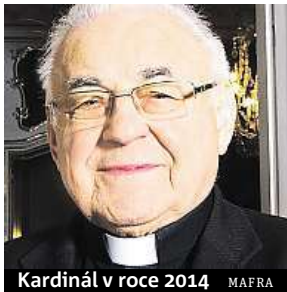
Kardinál v roce 2014

Kardinál Miloslav Vlk zemřel ve věku 84 let v sobotu v pražské nemocnici na Karlově náměstí. V posledních měsících trpěl rakovinou plic s metastázemi do kostí. Lítost nad úmrtím kardinála vyjad-