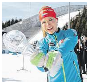
Gabriela Koukalová

Česká biatlonistka Gabriela Koukalová získala na závěr Světového poháru v Oslu dvě trofeje.