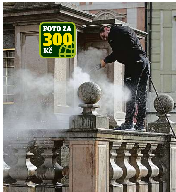
Čištění sloupu na Staroměstském náměstí.