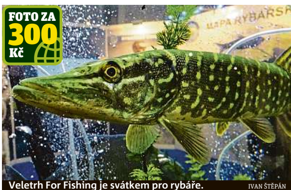
Veletrh For Fishing je svátkem pro rybáře.