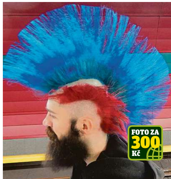
Tenhle účes zdobí stanici metra Bořislavka.