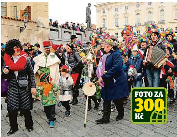
Masopustní průvod prošel i kolem Hradu.