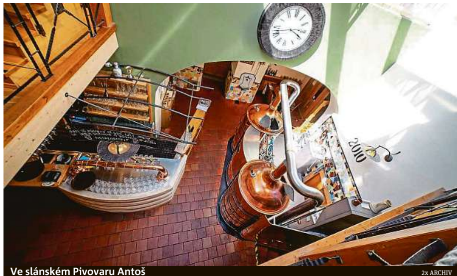
Ve slánském Pivovaru Antoš

Více tipů na výlety najdete na webu kladensko-slansko.cz. MET