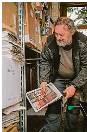
Metro = skvělá podestýlka

stanici dokončovat zabydlovací práce, tak aby byli na jarní nápor dobře připraveni. „Nejvytíženějším měsícem je tradičně červen. V minulém roce přijala stanice jen v červnu 907 pacientů, za rok to pak bývá v souhrnu kolem pěti tisíc,“ doplňuje Fišerová. V hlavní budově nového jinonického areálu má po jejím dokončení opět probíhat intenzivní péče. Na tuto budovu budou navazovat univerzální voliery, dále voliery pro velké ptáky, vodní ptáky, například labutě, a rozletové voliery pro dravce. Ty se používají pro to, aby záchranáři zjistili, jestli jsou tyto ptáci schopni se v přírodě pohybovat tak, jak mají. Vyrostou zde i výběhy pro vysokou zvěř a odchovna veverek.