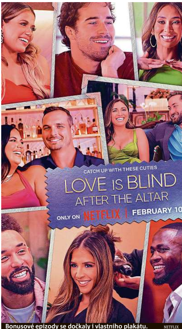
Bonusové epizody se dočkaly i vlastního plakátu.

Vlna mírného zklamání fanoušků ale Netflixu zase až tolik nevádí. Neuspokojivý přílepek klasických dílů oblíbené reality show totiž dobře slouží jako vábnička k dalšímu sledování. A to jak chystané čtvrté a páté řady Love Is Blind, které jsou již na pokyn Netflixu dávno v produkci, tak čerstvé novinky s názvem Jako ulití (Perfect Match).