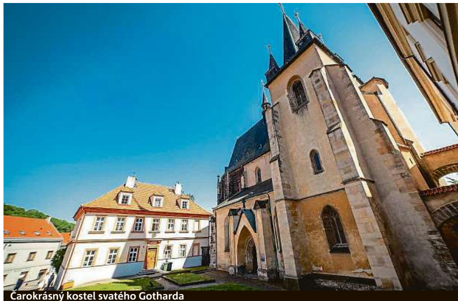
Carokrásný kostel svatého Gotharda

Nejvýznamnější sakrální gotickou památkou je kostel sv. Gotharda. Jeho základy zpevňují zbytky původního městského opevnění ze 14. století, jehož součástí je také zachovalá Velvarská brána. V té se nachází expozice