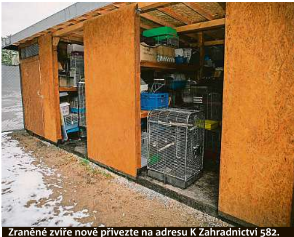
Zraněné zvíře nově přivezte na adresu K Zahradnictví 582.

Ďáblická stanice se podle pracovníků začíná v těchto dnech plnit prvními mláďaty zajíců, která však velmi často lidé „zachraňují“ zbytečně. „Zajáci jsou totiž mláďata, která matka odkládá a chodí je jen večer krmit. Chrání je tak před nechtěnou pozorností predátorů. Lidé se však mylně domnívají, že jsou osiřelá, a snaží se je zachraňovat. Bohužel takto odebraná mláďata se již nemohou vrátit zpět k matce a musí zůstat ve stanicích až do dospělosti,“ kroutí hlavou Fišerová s tím, že je únor našťastí jeden z klidnějších měsíců. A tak mohou ve