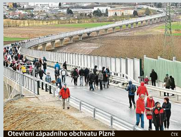
Otevření západního obchvatu Plzně

Aby bylo možné budovat nové dálnice a silnice a ty stávající kvalitně opravovat, je nutné zdrazit dálniční známky. Ministr dopravy Martin Kupka na CNN Prima News nové ceny známek nepředstavil, nicméně by šel po vzoru Rakouska, kde se známky zdrazují každoročně o inflaci. ČTK