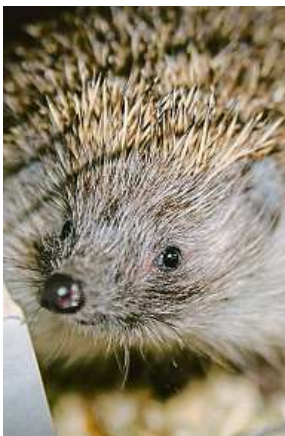
O ježky není nouze. 3x LHMP