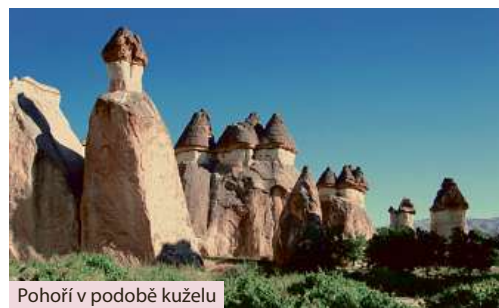
Pohoří v podobě kuželů