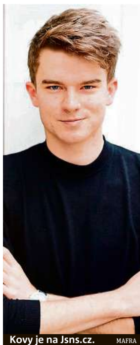
Kovy je na Jsns.cz.

Mluvit s nimi. Nikdo z nás nemá patent na pravdu a úplně všichni s informačním pře-