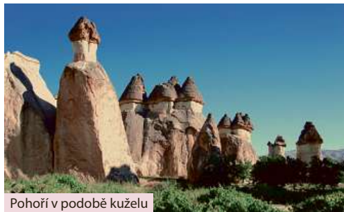
Pohoří v podobě kuželu