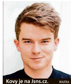
Kovy je na Jsns.cz. MAFRA

Moje videa na YouTube jsou pro všechny, tento konkrétní projekt hlavně pro druhý stupeň. Pokud bychom o něčem měli třeba na prvním stupni mluvit určitě, je to reklama, kterou spousta tvůrců i celebrit na sociálních sítích skrývá a dítě pak nemusí poznat, že se mu jeho oblíbený tvůrce snaží něco prodat. MAREK HÝŘ