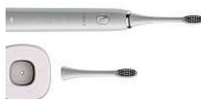
Chytrý kartáček 2x MIRONET

Šikovnou funkcí kartáčku UMAX je také časovač. Ten je nastaven na dobu čištění, ja-