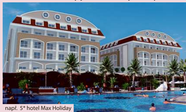
např. 5* hotel Max Holiday