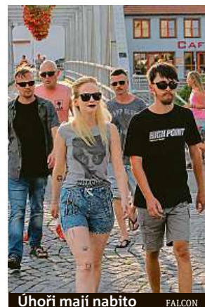
Úhoři mají nabito FALCON

„Oba se museli vyrovnat také s velkým vedrem. „To bylo skutečně náročné, nebylo se kam