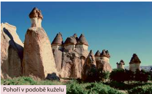
Pohoří v podobě kuželu