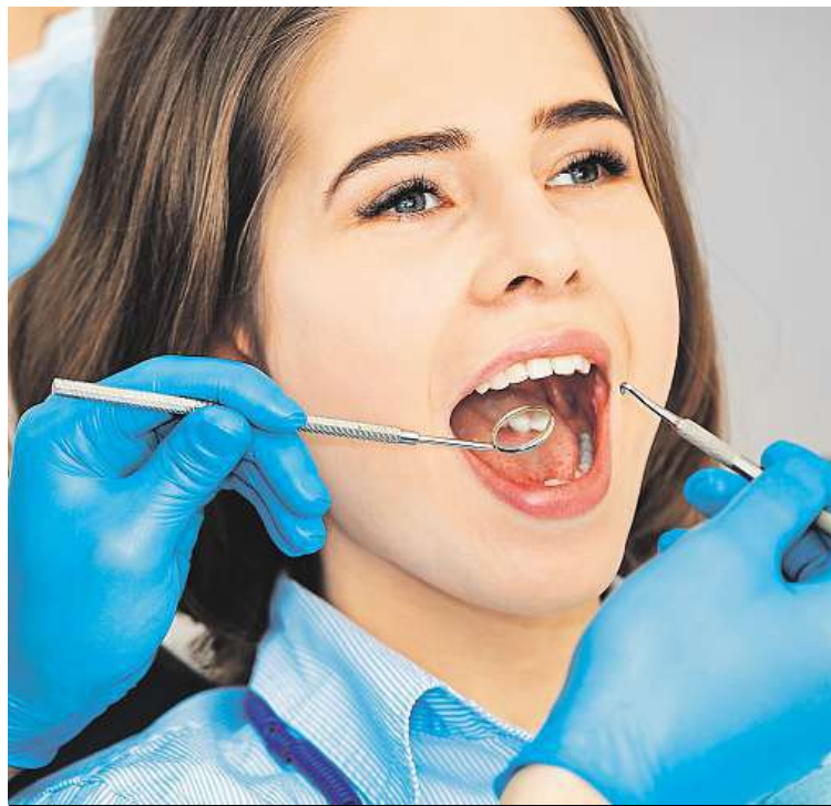
Prohlídku u zubního lékaře neoddlávejte.

Hygienistka může například u malých dětí objevit větší kazivost a upozornit na to lékaře nebo vám jeho návštěvu doporučit. Může i poradit návštěvu ortodonta, když má pocit, že by správnému růstu zubů pomohla rovnátka. U starších pacientů vysvětlením a výukou správné péče velmi výrazně prodlouží životnost a kvalitu jejich chrupu. KAMILA HUDEČKOVÁ