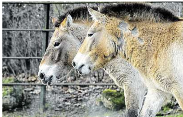
Stádo koní Převalského ve stanici v Dolním Dobřejově.

Po karanténě v hlavním městě dvojce klisen zamíří do Dolního Dobřejova a Mongolska.