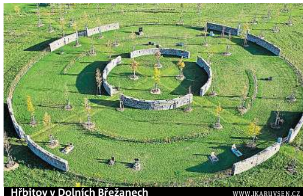
Hřbitov v Dolních Břežanech

Například v Suchdole, okrajové části Prahy. Nejbližší hřbitov pro Sedlecké je v neďalekých Únětčích. I to je pro zdejší lidi daleko. Proto už loni vypsal architektonickou soutěž na hřbitov, který zde vyroste okolo zdejší kaple svatého Václava.