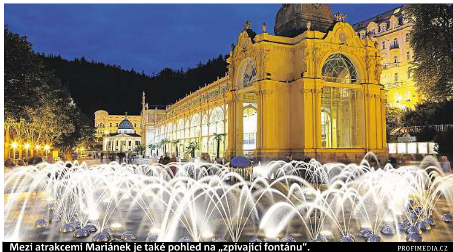
Mezi atrakcemi Mariánek je také pohled na „zpívající fontánu“.

Do Mariánek můžete vyrazit nejen na jaře nebo v létě – třeba ke Kladským rašelinám ve Slavkovském lese – ale také teď v zimě. Relax můžete spojit s lyžováním v místním skiareálu, který je vzdálen pouhých 400 metrů od lázeňské kolonády. Ačkoli se o víkend uoteplilo, mají tu ještě dostatek sněhu. Více na snowhill.cz/marianky . MAP