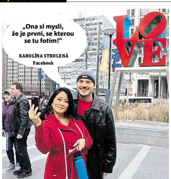
KAROLÍNA STROLENÁ Facebook Napište bublinu a reagujte na sloupek na: www.facebook.com/denikmetro