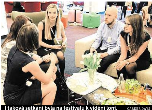
I taková setkání byla na festivalu k vidění loni. CAREER DAYS

Mimo jiné se můžete na Career Days těšit také na projekty Sliders, hudební přehrávač nové generace či SalesDock, kteří pomáhají ostatním startupům s obchodní strategií a budováním obchodních týmů.