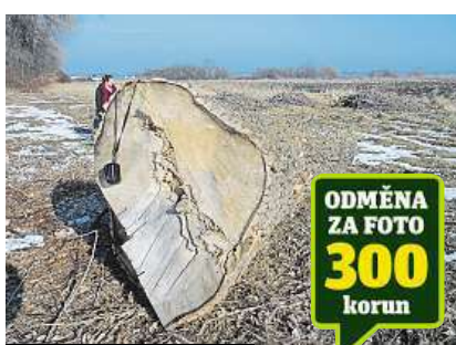
Kácení v Kolodějích

Podle dendrologa Aleše Rudla je nutné se obrátit v případě pochybností ohledně kácení na Českou inspekci životního prostředí.