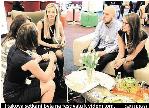
I taková setkání byla na festivalu k vidění loni. CAREER DAYS

Mimo jiné se můžete na Career Days těšit také na projekty Sliders, hudební přehrávač nové generace či SalesDock, kteří pomáhají ostatním startupům s obchodní strategií a budováním obchodních týmů.