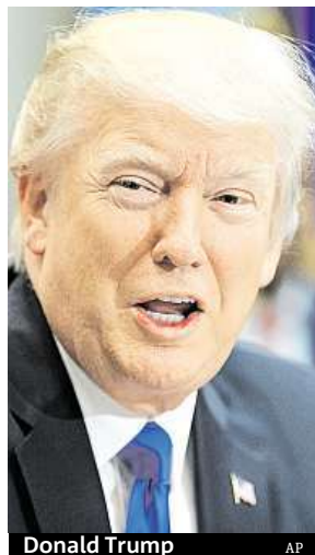
Donald Trump

V hangáru na letišti ve městě Melbourne na Floridě Trump řekl tisícovkám aplaudujících stoupenců, že s nimi chce mluvit bez filtru falešných zpráv. Prohlásil, že nepoctivá média nemají zájem informovat pravdivě a publi-