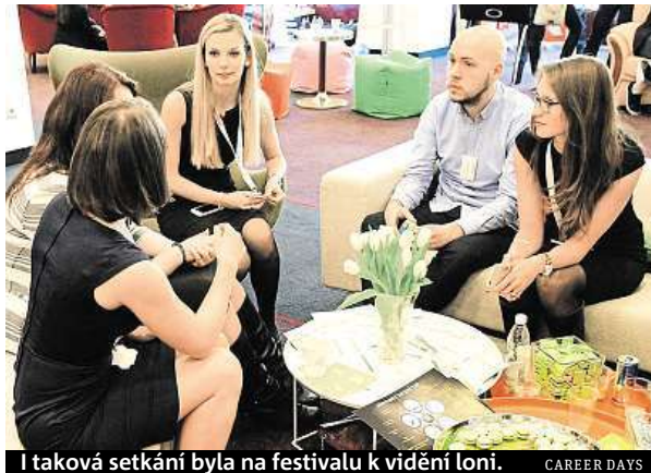
I taková setkání byla na festivalu k vidění loni. CAREER DAYS

Mimo jiné se můžete na Career Days těšit také na projekty Sliders, hudební přehrávač nové generace či SalesDock, kteří pomáhají ostatním startupům s obchodní strategií a budováním obchodních týmů.