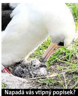
Napadá vás vtipný popisěk?

Napište bublinu a reagujte na sloupek na: www.facebook.com/denikmetro