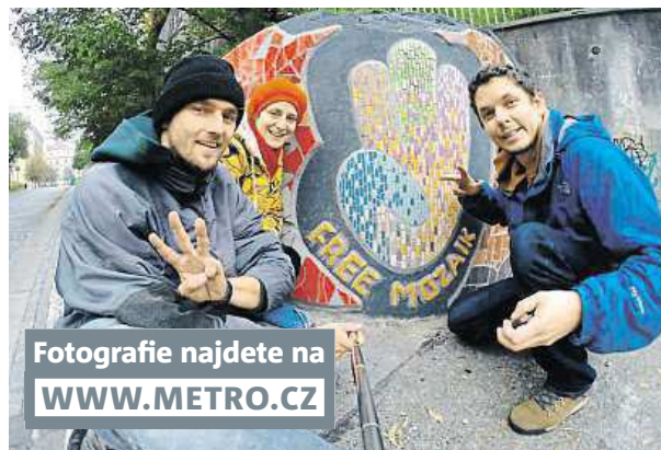
Fotografie najdete na WWW.METRO.CZ

Naše pouliční díla jsou k vidění především v Praze 10. Začali jsme dětským hřištěm v parku Heroldovy sady, kde jsme ztvárnili Strom života, inspirovaný Gustavem Klimtem, který byl zaměřen na dospělou obecenstvo, a na druhé stěně Podmořský svět pro dětské obecenstvo. Dále jsme pokračovali schodištěm v Borodinské ulici, kde je vyobrazen chlápek vykukující ze zdi, takzvané Oči nad Borodinskou. A nyní přibyla stěna hlav v Chorvatské ulici a had obepínající se kolem sloupku ve Slovenské ulici.