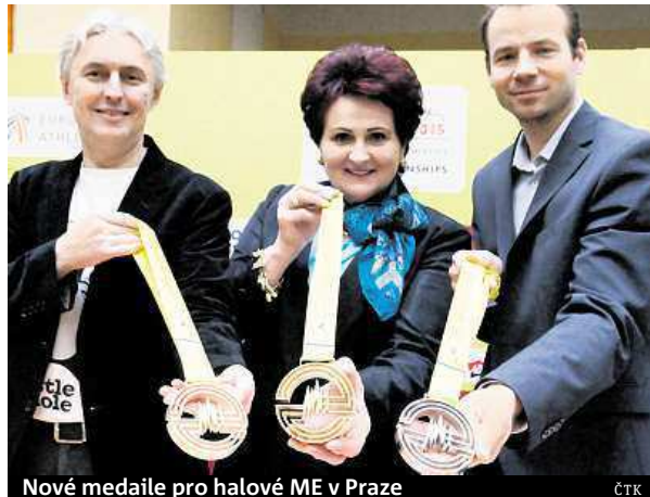
Nové medaile pro halové ME v Praze

„Mně spadl ze srdce obrovský balvan, medaile byly můj největší bolest. Je to totiž jedna z mála hmatatelných zlatých, ale s jejich podobou většinou spokojena nebyla. „Abych byla upřímná, tak je jedna horší než druhá. Myslim, že ty pro pražský šampio-