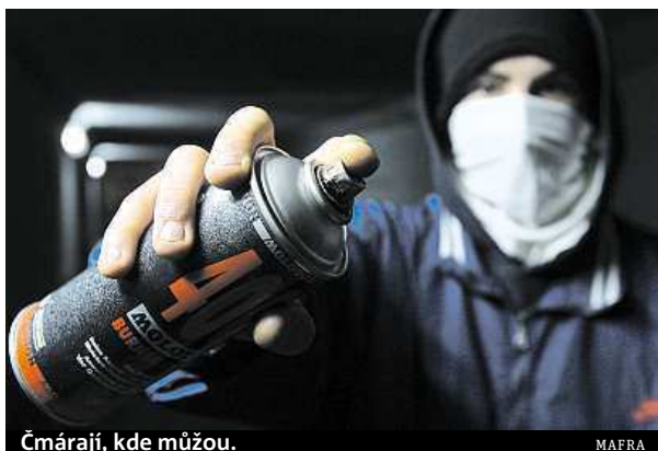
Čmárají, kde můžou.