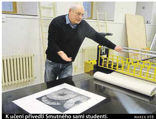
K učení přivedli Smutného sami studenti.