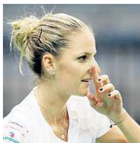
Karolína Plíšková

V boji o finále narazí dvacetiletá Plíšková na Gabriëlu Muguruzaovou, která si ve španělském souboji poradila poměrem 6:7, 6:3, 6:3 s Carlou Suárezovou, přemožitelkou Petry Kvitové.