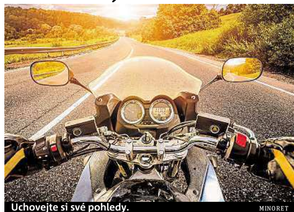
Uchovejte si své pohledy.

Můžete zvolit i vyšší model Goclever DVR Extreme Wifi, který podporuje full HD rozlišení nebo záznam šedesáti snímků za vteřinu i při nižší hmotnosti. Z 80 gramů je odlehčená na finálních 62 včetně bezdrátového modulu.