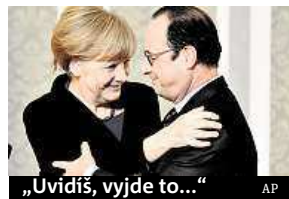
„Uvidíš, vyjde to...“

Zbraně měly utichnout na donbaské frontě ze soboty na neděli. Tuhé boje o Debalceve přitom skončily teprve předevčirem, již nyní jsou hlášené nové boje kolem dalšího strategického města Mariupolu. Povstalci pracovníky OBSE pouštějí jen tam, kam chtějí. Mezitím přicházejí s dalšími podmínkami, které v Minsku nebyly dohodnuty. Ani druhá minská dohoda, dokonce se jmény Merkelová a Hollande, nic neřeší. NEK