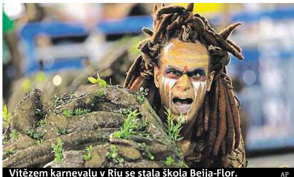
Vítězem karnevalu v Riu se stala škola Beija-Flor.

Celkem šest brazilských radnic bylo letos nuceno zrušit karnevaly ve svém městě. Věc nevídaná. Důvodem bylo extrémní sucho, které zasáhlo čtvrtinu brazilského území. Nedostatek vody ovlivnil podobu i největšího karnevalu na světě v Rio de Janeiro. Ten letos přilákal do města přes 920 tisíc turistů. Tamní školy samby byly nuceny změnit i své choreografie, které se letos musely obejít bez vody – nahradily ji kouřo-