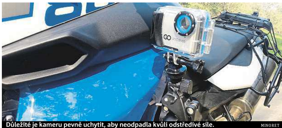
Důležité je kameru pevně uchytit, aby neodpadla kvůli odstředivé síle.

Těžko bychom tehdy čekali, jak populárním formátem se video stane, co budeme natáčet a jaké kamery k tomu budeme potřebovat. Jak ale vybrat outdoorovou kameru?