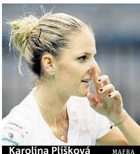
Karolína Plíšková

V boji o finále narazí dvacetiletá Plíšková na Gabriëlu Muguruzaovou, která si ve španělském souboji poradila poměrem 6:7, 6:3, 6:3 s Carlou Suárezovou, přemožitelkou Petry Kvitové.