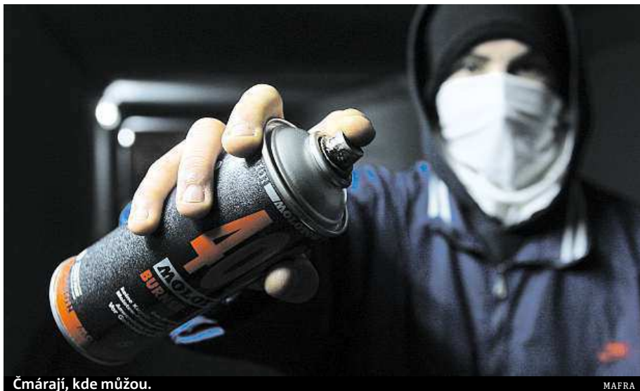
Čmárají, kde můžou.