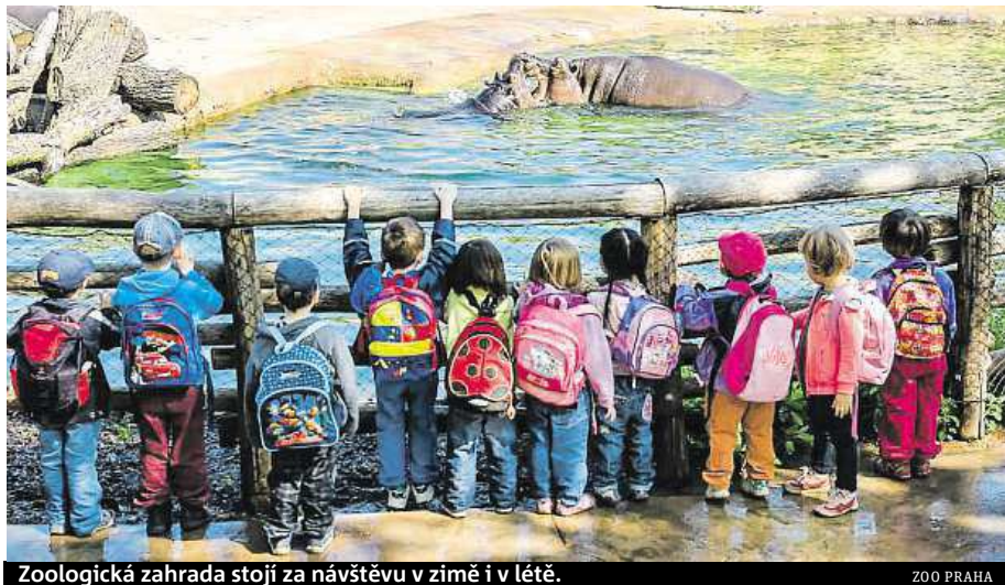
Zoologická zahrada stojí za návštěvu v zimě i v létě.