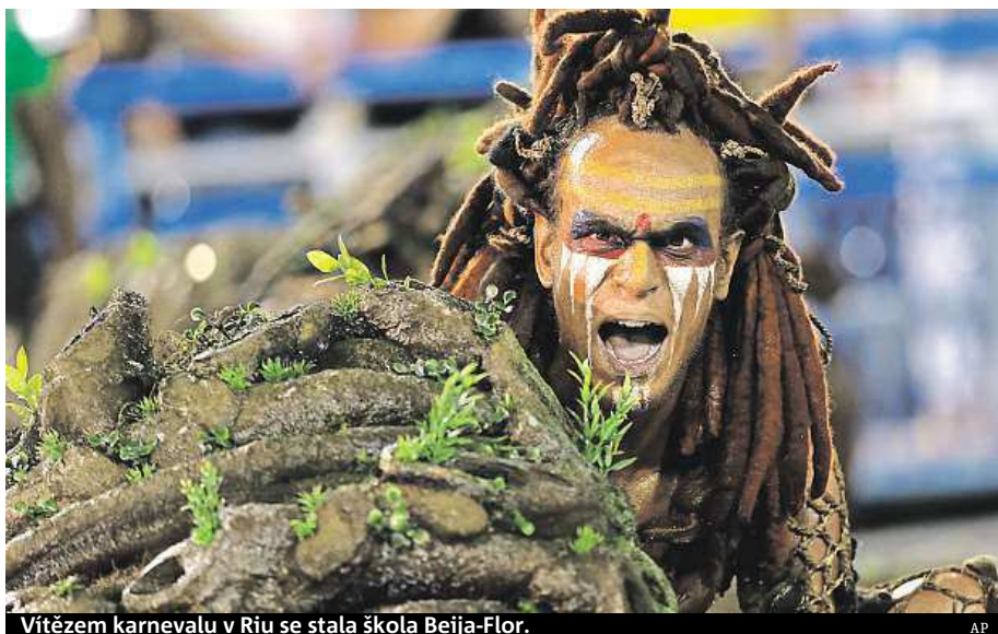
Vítězem karnevalu v Riu se stala škola Beija-Flor.

Celkem šest brazilských radnic bylo letos nuceno zrušit karnevaly ve svém městě. Věc nevídaná. Důvodem bylo extrémní sucho, které zasáhlo čtvrtinu brazilského území. Nedostatek vody ovlivnil podobu i největšího karnevalu na světě v Rio de Janeiru. Ten letos přilákal do města přes 920 tisíc turistů. Tamní školy samby byly nuceny změnit i své choreografie, které se letos musely obejít bez vody – nahradily ji kouřovými a světelnými triky. „Nemá smysl používat tolik vody, když lidé trpí jejím nedostatkem,“ cituje španělský