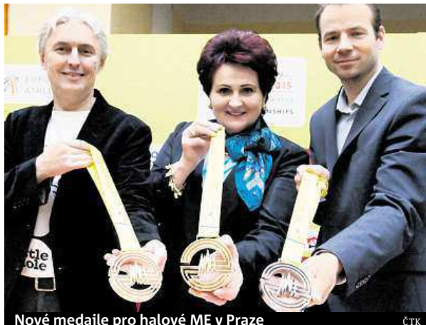
Nové medaile pro halové ME v Praze