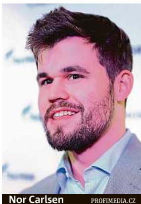
Nor Carlsen

Mistr světa v šachu Magnus Carlsen byl nejlépe vydělávajícím hráčem esportu v loňském roce. Na platformě Chess24 si na premiích vydělal v přepočtu asi 11 milionů korun, díky čemuž se dostal do čela žebříčku sázkové společnosti Unikrn specializující