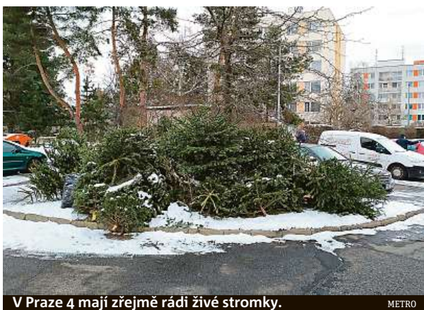
V Praze 4 mají zřejmě rádi živé stromky.

Nápor povalujících se jehličnanů přišel tento týden. Hromadu v Praze 4 stihli uklidit včera.