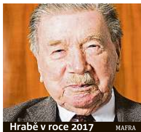
Hrabě v roce 2017 MAERA

šachtě, sloužil u Pomocných technických praporů a později pracoval například jako kulisák. V roce 1968 emigroval do Rakouska, po roce 1989 dostal hrad v restituci zpět. Od té doby zde bydlel. ČTK