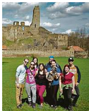
Úplně první výlet