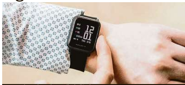
Jsou chytré a zároveň slušivé.

Pásek hodinek díky speciální technologii molekulární mřížky vydrží suchý a je navíc také odolný vůči špíně, takže hodinky můžete bez obav nosit po dlouhé časové úseky, čemuž dopomáhá i 200mAh polymerová Li-Ion