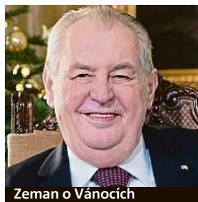
Zeman o Vánocích

Ministr zdravotnictví Jan Blatný hejtmanům slíbil upravit rezervační systém k očkování proti covidu-19. Asociace krajů uvedla, že centrální systém nyní de facto nutí seniory k soutěžení o termíny, což považuje za nedůstojné. Kabinet by podle Blatného slibu měl úpravy oznámit v nejbližší době. Senioři se mohou k očkování hlásit od pátečního rána. Blatný poslancům řekl, že se zatím registrovalo zhruba 160 tisíc seniorů, tedy asi 40 procent z nich. Více než 58 tisíc jich má rezervován termín. Blatný podle asociace upozornil na chystané změny v registraci, které by měly systém zásadně zjednodušit a zpřehlednit.