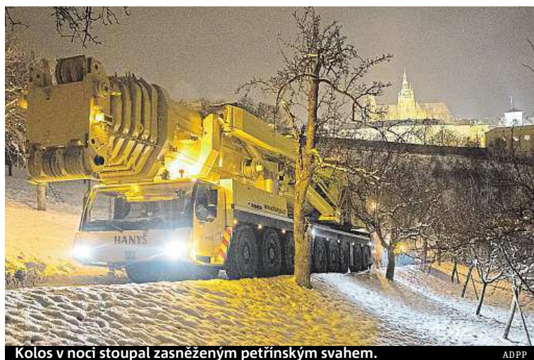
Kolos v noci stoupal zasněženým petřínským svahem. ADPP

Netradiční podívaná se včera v noci odehrávala na Petříně. Z Újezda vzhůru až na Nebozízek couval gigantický jeřáb, druhý největší stroj svého druhu v Česku. Jeřáb si na Petřín objednal stavební firma SMP, která pro dopravní podnik opravuje lanovku. „Velikost jeřábu odpovídá zamýšlené práci. Tedy uložení 13 tunových prefabrikátů na místo určené z jednoho místa,“ vysvětluje mluvčí dopravního podniku Aneta Řehková.