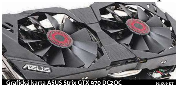
Grafická karta ASUS Strix GTX 970 DC2OC

Důležité jsou samozřejmě i další faktory, jako dostatečně výkonný procesor, vhodná základní deska, správný systém chlazení a mnohé další, nicméně to nejpodstatnější stojí a padá na zmíněné grafické kartě. Rozhodně tak není radno podceňovat její výběr, doporučujeme zaměřit se na prověřené výrobce karet s prokázanou kvalitou.