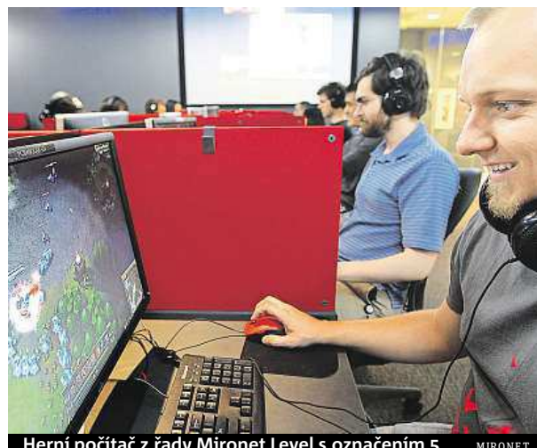
Herní počítač z řady Mironet Level s označením 5

V ceně je také zahrnut operační systém Windows 10, takže již nic nebrání tomu, ponořit se do nekonečného světa zábavy.