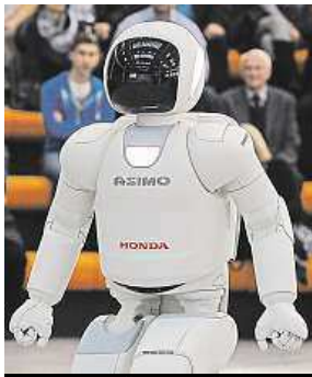
Roboti umějí dost věcí. MAFRA

Čtyři z deseti mladých lidí se domnívají, že jejich práci budou do deseti let vykonávat stroje.