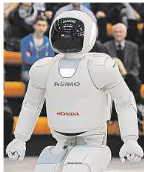
Roboti umějí dost věcí. MAFRA

Čtyři z deseti mladých lidí se domnívají, že jejich práci budou do deseti let vykonávat stroje.