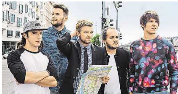
Haviřovská kapela Nebe