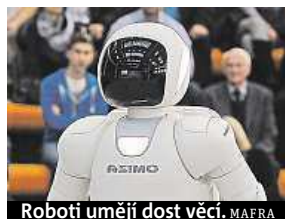
Roboti umějí dost věcí.

Čtyři z deseti mladých lidí se domnívají, že jejich práci budou do deseti let vykonávat stroje.