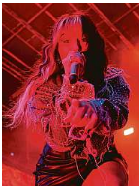
Ewa Farna vyprodala stadion Eden rok dopředu.

Světové legendy, stadionové show i domácí stálice. Nabídka koncertů v Česku slibuje mimořádně silný hudební rok.