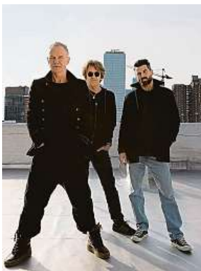
Sting (vlevo) vystoupí na 10. ročníku Metronome Prague