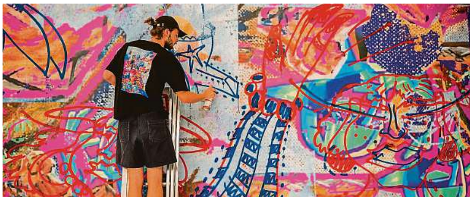
Bican má na svém kontě celou řadu projektů. Nasprejoval například mural v Olomouci, na triku má i spolupráci se značkami Puma a Zalando.