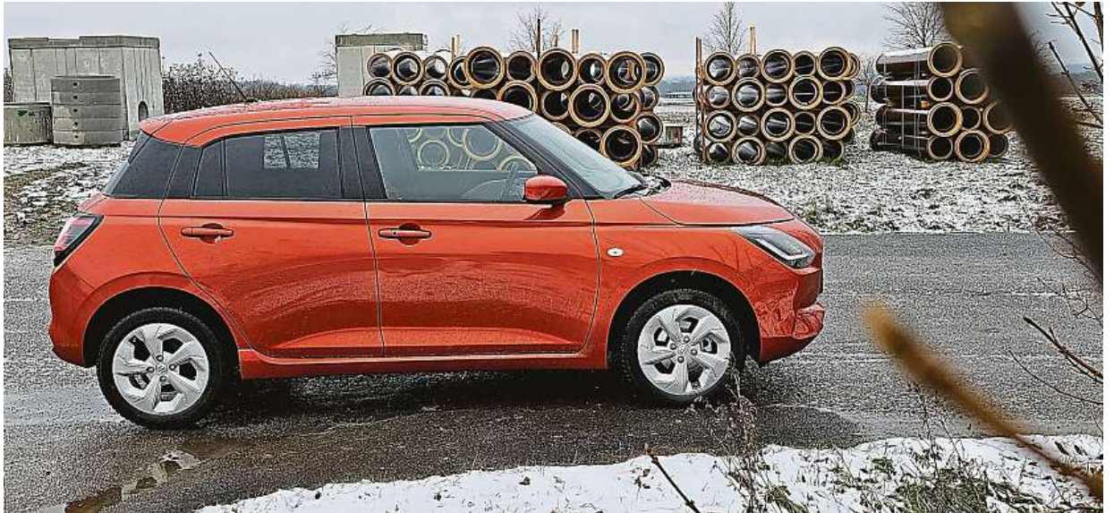
Swift je mild-hybrid. Má tedy integrovaný startér-generátor (ISG) a lithium-iontovou baterii, která se průběžně dobíjí.