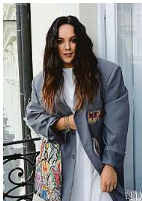
Bicanovo oblečení obléká například i slavnice Ewa Farna.