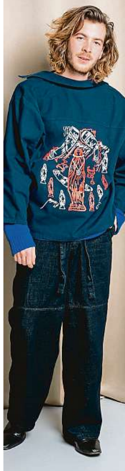
Bican v Hongkongu vystavuje do konce roku.