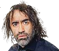
JAKUB KOHÁK TROCHU NA HAVLA

No a nesmím zapomenout na významnou událost, jež obohatila českou významologii a slovesnost vůbec. Jde o to, že můj kamarád přišel na návštěvu ke své mamince a ta mu poté, co ho uviděla, řekla: „Ty chodíš po ulici s takovýmhle Kohákem?!“ Jedná se o nový obrat, kdy „mít na sobě Koháka“ znamená, že je muž sympatický a milý, ovšem jaksi neupravený, neoholený... zkrátka má divoký vzhled. A lidé už to začínají říkat podobně, jako se říká „ostříhat se na Havla“. Tak ať ten příští rok máte trochu na Havla a trochu na Koháka.