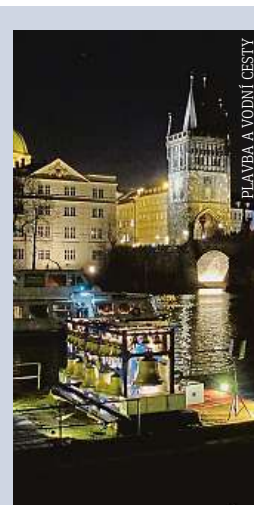
PLAVBA A VODNÍ CESTY