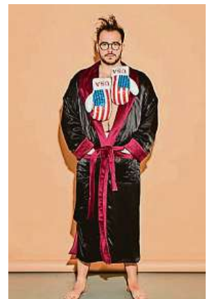
Inspirováno japonským stylem a českým domovem

bek, který je vyroben v omezeném množství,“ vysvětluje pro deník Metro Křivánek.