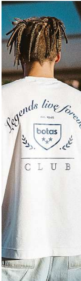
Oblečení od ikonické značky seženete do Vánoc. BOTAS