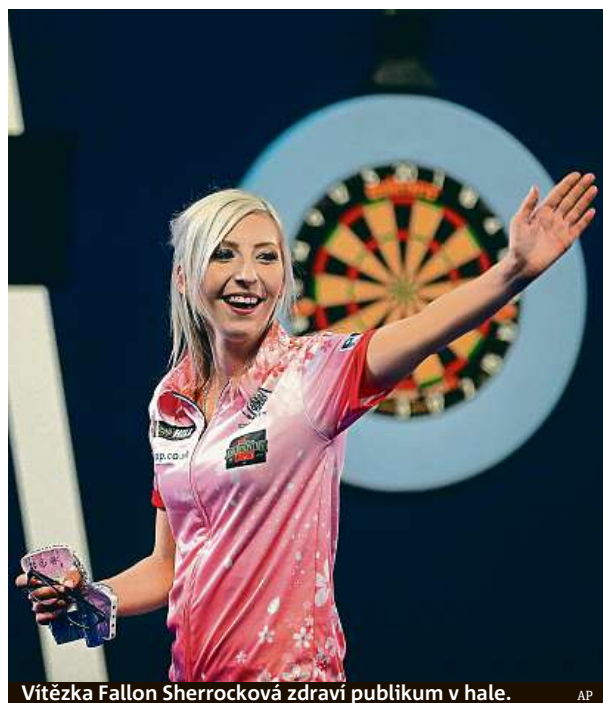
Vítězka Fallon Sherrocková zdraví publikum v hale.

Vedení olomoucké radnice podepsalo smlouvu s hokejovým klubem HC Olomouc, které jsou podle města klíčové pro budoucnost provozování zimního stadionu a podporu ledního hokeje v Olomouci. Roční vyjednávání radnici zavázalo k tomu, že bude ročně do provozu haly investovat 15 milionů korun a dalších devět milionů bez DPH bude platit extraligovému klubu za propagaci města. ČTK