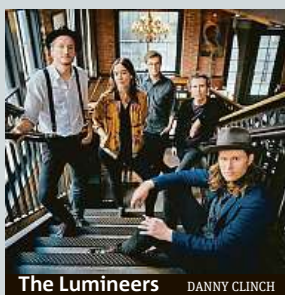
The Lumineers DANNY CLINCH

Hudební festival Colours of Ostrava přidává další kapely a hudebníky. Třeba folkrockové The Lumineers, mladou norskou zpěvačku Sigrid či severskou formaci Wardruna. Vstupenky na festival, který se koná od 15. do 18. 7., vyjdou na 2990 korun.