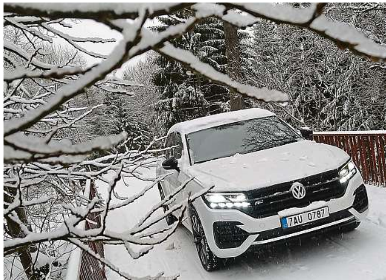
Sněhu se nebojte! Systém pohonu všech kol z auta sánky vážně neudělá.