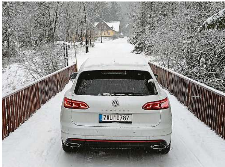
Připravte si nejméně 2,3 milionu korun. Čekejte pořádnou jízdu.