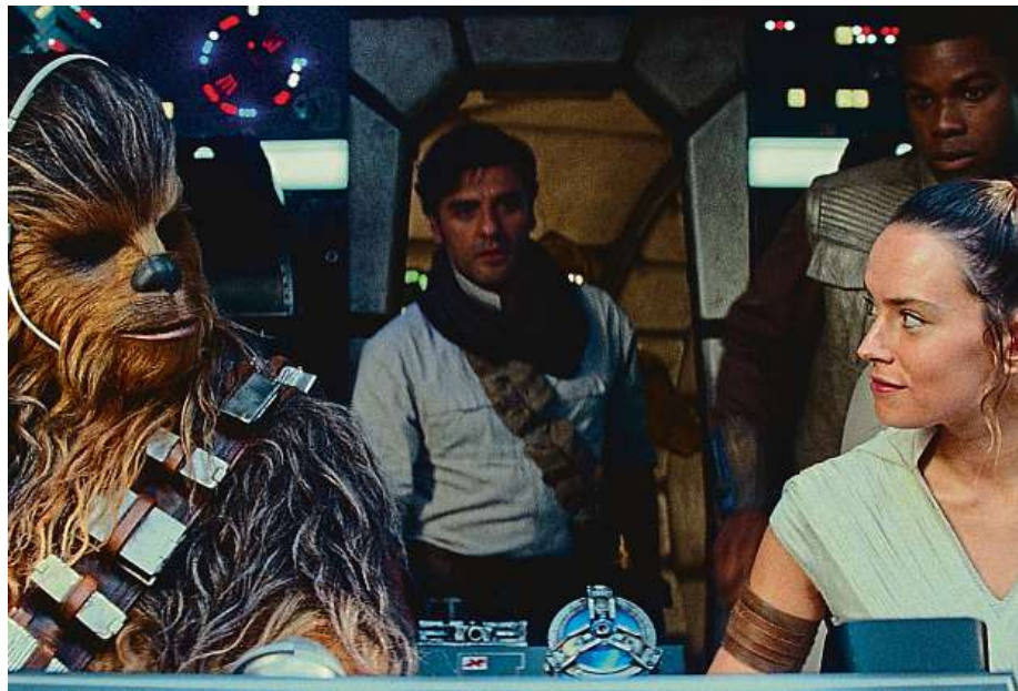
Zleva: Chewbacca alias Žvejkal, Poe Dameron, Finn a Rey letí vstříc dobrodružství. FALCON

Abramsův nástupce Rian Johnson se totiž rozhodl překvapovat po svém. Režisérovi osmého snímku ze světa Hvězdných válek s podtitulem Poslední z Jediů se povedlo otázkou opravdu hodně lidí. Přistoupil totiž k látce podstatně osobitěji než Abrams, což nebylo mnoha fandům po chuti. Na plátně předvedl jízdu, jež ve snaze diváka překvapit smetávala předchozím filmem nastolené otázky ze stolu, jindy zaváděla postavy do slepých uliček či jejich cesty úplně ukončovala. Osobně jsem si nápaditost osmých Star Wars velmi užil a byl jsem zvědav, jak se režisér devátého pokračování popasuje s nelehkým úkolem na Johnsonův snímek navázat. Pro jeho natáče-