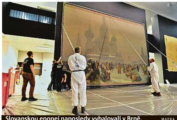
Slovanskou epopej naposledy vybalovali v Brně.

K trvalému vystavení by pomohla výstavní síň. Tak, jak si to přál už sám autor Alfons Mucha. Jenže se o tom pořad jenom hovoří. Už celá desetiletí, od chvíle, kdy malíř celý cyklus obrazů věnoval hlavní-