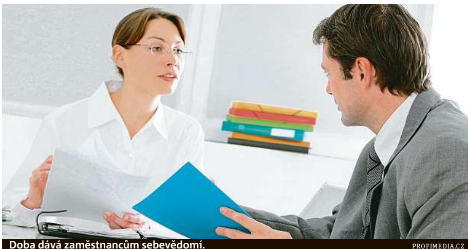
Doba dává zaměstnancům sebevědomí.

Je otázkou, zda se za výraznou převahou strategie odchodu neukrývá i další faktor: lidé nejdou do vyjednávání o platu. Důvodů může být