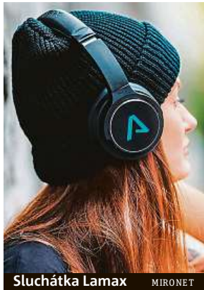
Sluchátka Lamax MIRONET

Bezdrátová sluchátka s dlouhou výdrží a kvalitní izolací okolního hluku.