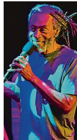
Bobby McFerrin