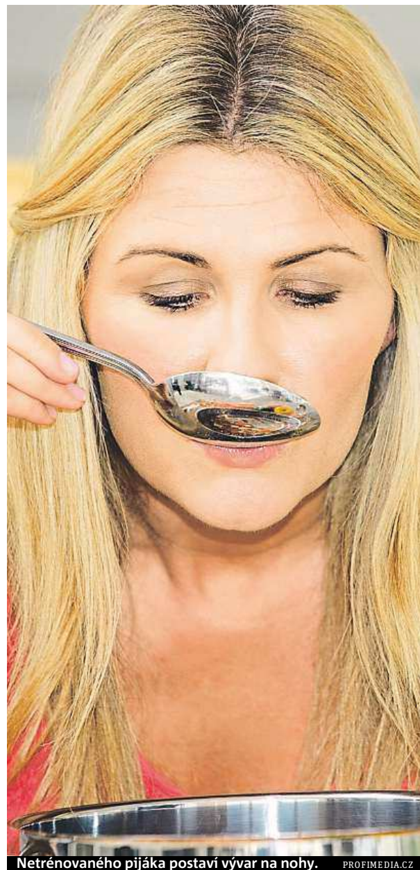
Netrénovaného pijáka postaví vývar na nohy.