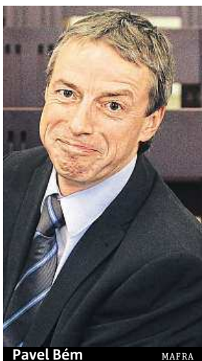
Pavel Bém

O DROGÁCH: „Měl jsem poměrně divoké dospívání, takže jsem leccos vyzkoušel. Ochutnal jsem snad všechno od trávy po všemožné psychedelické a halucinogenní látky. Typický mediální příběh,