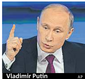
Vladimir Putin

Za všechno může západ, na Ukrajině bojují dobrovolníci, kteří uposlechli volání svého srdce. Putin měl tiskovku.