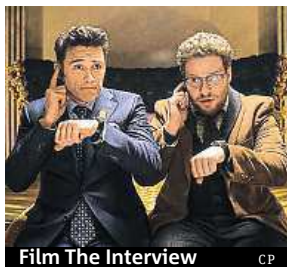
Film The Interview CP

Studio Sony Pictures mělo 25. prosince uvést do kin filmovou parodii The Interview pojednávající o atentátu na vůdce KLDK Kim Čong-una. Ve středu ale uvedení snímku do kin studio zrušilo. Hollywoodští herci to kritizovali jako hrozbu pro svobodu projevu a označili to za vítězství hackerů, napsal zpravodajský server BBC News. Komik