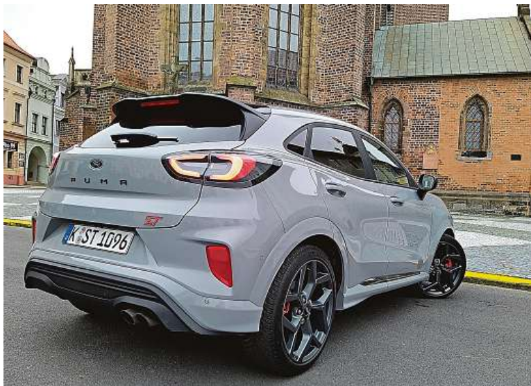
Uplná novinka v Česku budila pozornost i na náměstí v Hradci Králové.