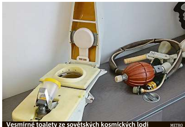
Vesmírné toalety ze sovětských kosmických lodí

ve vesmíru už tři dny. Protože se jí ale nepodařilo správně použít tehdejší primitivní nádoby na vyměšování, nešťastnou shodou náhod její obsah „vystřelil“ do modulu. Postupem času, pro kratší pobyty, se začalo vymýšlet spodní prádlo s odvodem moči. Itak se, a to platí dosud, snaží lidé ve vesmíru oddalovat potřebu co nejdéle. Čím méně stravy v beztlížném stavu konzumují, tím méně odpadu vyprodukuje. Protože, hlavně v počátcích kosmonautiky, to byl proces, který ne každému voněl. Například od 60. let minulého století používali američtí astronauti defekační polyetylenové sáček se samolepicím okrajem. Ten si nalepili na hýždě. Proces ve stavu beztlíže byl komplikovaný tím, že pevný odpad z těla nikam sám o sobě nepadá, kosmonaut mu proto musel