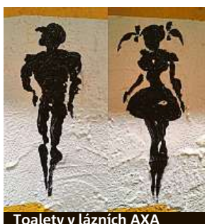
Toalety v lázních AXA