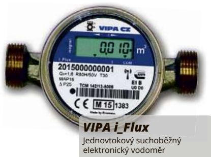
VIPA i Flux Jednotkový suchoběžný elektronický vodoměr

Systém měření a výpočtu úhrady za vytápění