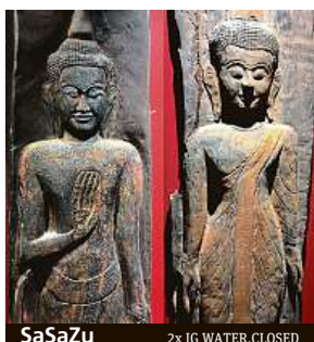
SaSaZu 2x 1G WATER.CLOSED