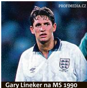
Gary Lineker na MS 1990

V roce 2002 si při zápase mistrovství světa reprezentant USA DeMarcus Beasley ulevil u postranní čáry, když se rozvíčoval jako náhradník. Vůbec nejhorší zážitek ale asi měl anglický reprezentant Gary Lineker na MS 1990. Při utkání s Irskem nechtěně na hřišti vykonal i velkou po-