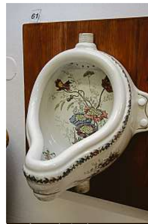
Malovaný pisoár METRO

víme, tak publikace tohoto druhu ve světě neexistuje. Jako téma se to sem tam objeví, ale jen jako součást nějaké knihy či studie, podrobně to zatím nikdo nezmapoval,“ říká manželé. PAVEL HRABICA