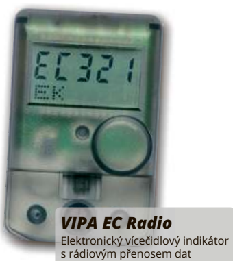
VIPA EC Radio Elektronický vícečíslový indikátor s rádiovým přenosem dat