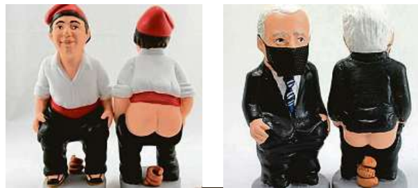
Klasický caganer (vlevo) a Joe Biden s rouškou 2x CAGANER.COM

Káležící postavička v katalánských betlémech je symbolem prosperity.