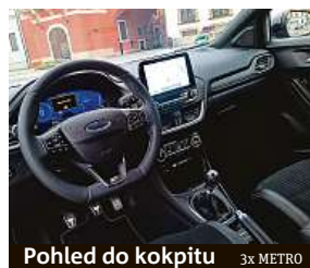
Pohled do kokpitu 3x METRO

Díky tomu, že zadní náprava je mnohem tužší než u klasické verze, že je zde volitelný mechanický diferenciál, že má dodatečné stabilizátory, skvělé brzdy a devatenáctipalcové sportovní pneumatiky, jde o řídicíky zajímavé auto. Při ostrých kličkách mezi kužely na polygonu nás