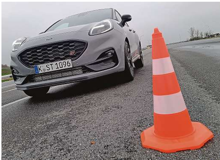
Na polygonu na letišti v Hradci jsme udělali několik rychlých koleček.

Má jen tríválec, ale šelmička umí i s ním pěkně vyceňit zoubky. První jízda s Fordem Puma ST.