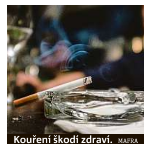
Kouření škodí zdraví. MAIRA

Odborníci odhadují, že zatímco 300 tisíc lidí se s CHOPN léčí, dalších 300 tisíc o nemoci neví. „Potýkájí se s chronickým kašlem, únavou, zadýchávají se, ale k lékaři nejdu. Pro ně pořádá-