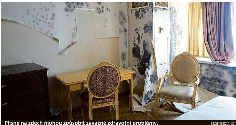
Plíseň na zdech mohou způsobit závažné zdravotní problémy.

Z plísní se totiž uvolňují spory, které se pohybují vzduchem podobně jako prach. Čím déle člověk v takto zamořeném prostředí pobývá, tím se riziko, že se u něj alergie projeví, zvyšuje. Dvojnásob to platí u dětí a jinak zdravotně oslabených lidí. Nechcete-li mít v bytě plíseň, je po-