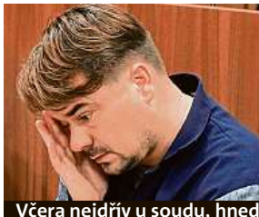
Včera nejdřív u soudu, hned po něm urychleně odjel.