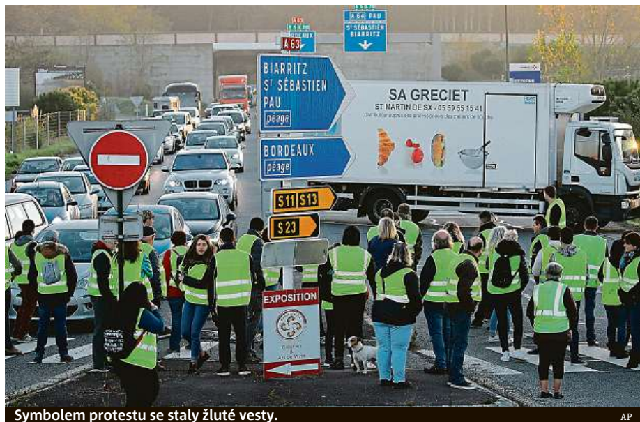
Symbolem protestu se staly žluté vesty.