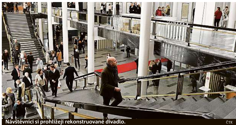
Návštěvníci si prohlížejí rekonstruované divadlo.