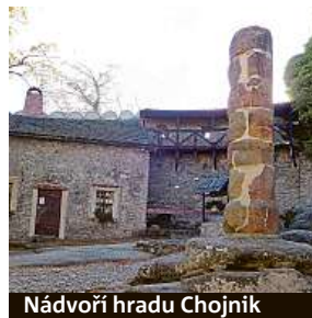
Nádvoří hradu Chojnik

Pokud chcete poznat pohled na krkonošský hřeben z „druhé strany“, vydejte se na hrad Chojnik. Postavili ho ve 14. století a dosud stojí na vrcholu kopce v nadmořské výšce 612 metrů. Návštěva stojí za to. Z hradní věže se otevírá úchvatné panorama. Jednak na horský hřeben, jednak na opačnou stranu do podhůří směrem ke správnímu centru oblasti Jelení hoře. Hrad je pří-