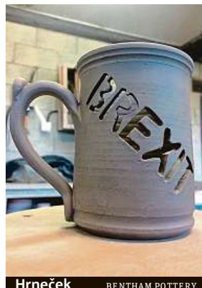
Hrneček BENTHAM POTTERY

„Šálky čaje jsou vždy spojovány s britskou společností. A tohle byl neškodný způsob, jak ukázat, jaký mám na brexit názor,“ cituje hrnčíře server deníku Independent. Do jedné strany keramické