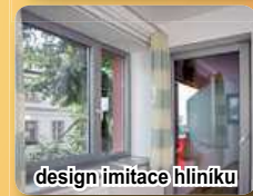
design imitace hliníku