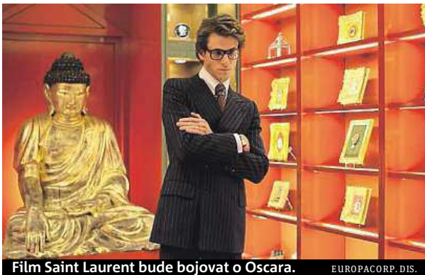
Film Saint Laurent bude bojovat o Oscara.

To o pár měsíců mladší životopisné drama Bertranda Bonella s názvem Saint Laurent, které do české distribuce dorazí až v lednu, vyšlou