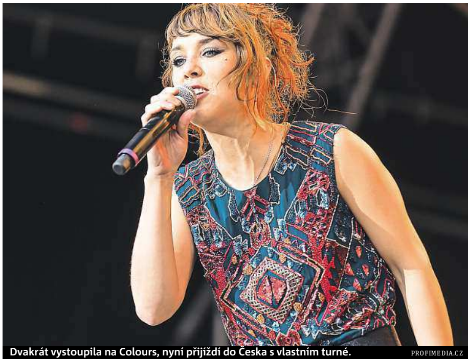
Dvakrát vystoupila na Colours, nyní přijíždí do Česka s vlastním turné.