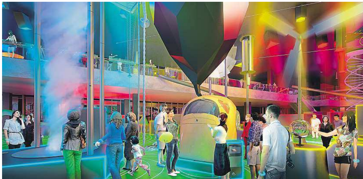
Tak bude vypadat centrum v bývalém pavilonu D Výstaviště. Otevřeno bude denně od 10 do 18 hodin.

VIDA! Pro každého, kdo se chce něco dozvědět, se otevírá 1. prosince. Zemětřesení. Můžete je zažít na vlastní kůži. Mravenčí zoo. Zjistěte, co máme společné STRANA 2