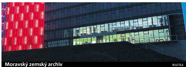
Moravský zemský archiv