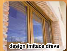
design imitace dřeva