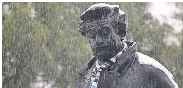
Oslavy budou veselejší, slibují organizátoři.