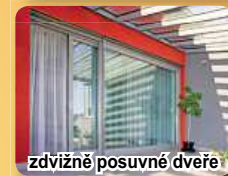
zdvíhací posuvné dveře