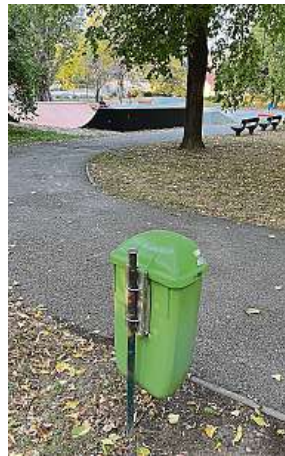
Obhlídku Skateparku Jinonice za nás udělal mluvčí Prahy 5.

„Vlastní obhlídkou Skateparku Jinonice jsem našel hned tři koše na dohled od sportoviště. Městská část Prahy 5 dosud nezaznamenala poptávku občanů po odpadkových koších. Pokud by takový požadavek nastal, podle vyjádření paní místostarostky Moniky Shaw Salajové,