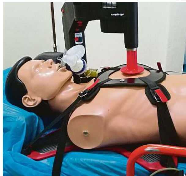
Masážní přístroj nahradí zdravotníka, může bez únavy oživovat srdce několik hodin. Pomáhá především při prevozech v sanitce. METRO