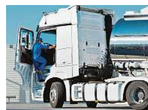
Kamion lze řídit po dosažení věku 21 let.