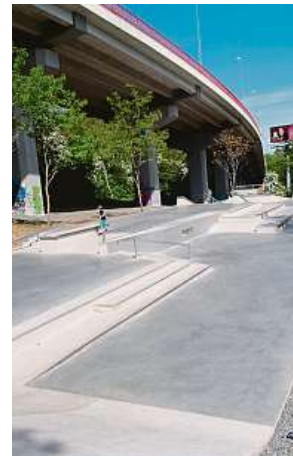
Skatepark pod vysočanskou estakádou je bez košů. METRO

„Během letošních letních měsíců došlo k výrobě a instalaci všech prvků a k dokončení projektu. Celkové náklady hrazené z prostředků městské části činí 3,2 milionu korun,“ shrnuje místostarosta pro územní rozvoj Radek Janoušek a doplňuje, že milionem korun na opravu sporto-