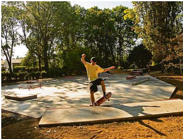
Vedení Prahy 5 plánuje vznik dalších skateparků. Letos chce otevřít nový na Smíchově, další chystá v Košířích a na Barrandově. 2x PRAHA 5

„Zde koše jsou. Dokonce mají i sjednocenou podobu