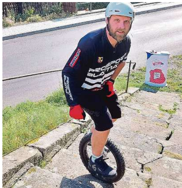
Rekordman vyskákal schody ke kostelu celkem jednadvacetkrát.