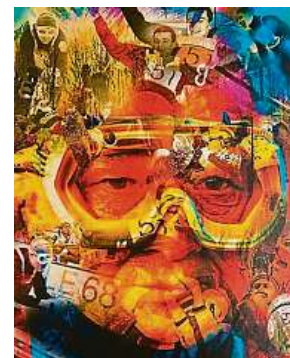
Lidé na konci své životní cesty v podání fotografa

lizovala v září tohoto roku agentura STEM/MARK, má osobní zkušenost s úmrtím blízké osoby 88 procent veřejnosti.