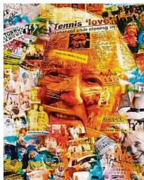
Fotografie pro koláže vznikaly v hospicu. 3x CPP

Poskytovat ji lze v domácím prostředí i ve zdravotnických zařízeních jako hospic či nemocnici. Podle nejnovějšího průzkumu, který pro Centrum paliativní péče zrea-