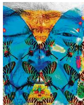
Série obrazů Jiřího Machta má třináct zastavení.