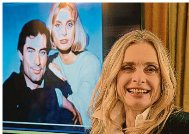
Maryam d'Abo, bondgirl z filmu Dech života z roku 1987