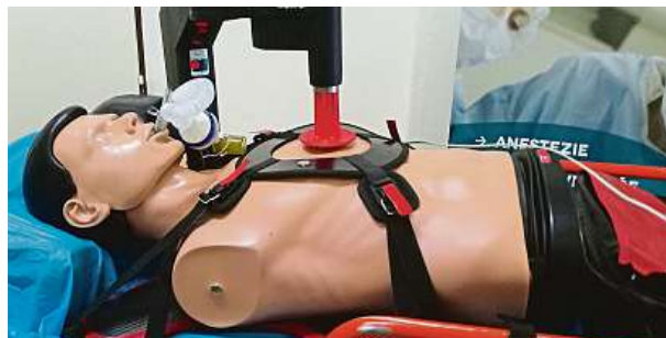
Masážní přístroj nahradí zdravotníka, může bez únavy oživovat srdce několik hodin. Pomáhá především při převozech v sanitce. METRO

Kancelář řádkové inzerce: Václavské náměstí 1, palác koruna, Praha 1, po-pá 8.30 - 17.00 hod. Tel: 225 065 177, 178