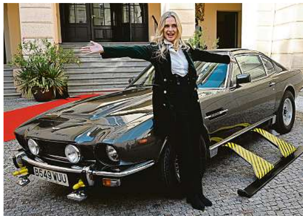
Auta jsou se snímky o agentovi 007 neodmyslitelně spjata.