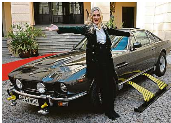
Auta jsou se snímky o agentovi 007 neodmyslitelně spjata.