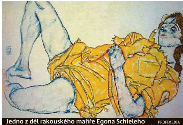
Jedno z děl rakouského malíře Eгона Schieleho

Rakouská metropole si zřídila profil na sociální síti OnlyFans, kde uživatelé mohou sdílet i obsah pro dospělé.