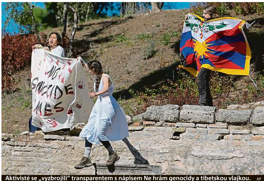
Aktivisté se „vyzbrojili“ transparentem s nápisem Ne hraj genocidy a tibetskou vlajkou. AP

Pochodeň byla převezena na Akropoli a dnes ji při krátkém ceremoniálu na Panathénském stadionu v Athénách převezmou čínští organizátoři. Ještě týž den bude oheň převezen do Číny. Hry v Pekingu začnou 4. února, kvůli koronaviru se budou konat bez zahraničních fanoušků. Bez přítomnosti veřejnosti se v březnu uskutečnilo také zapalování ohně před letními hrami v Tokiu. ČTK