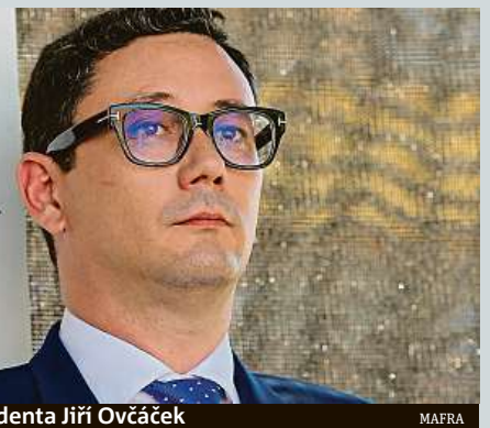
Mluvčí prezidenta Jiří Ovocáček