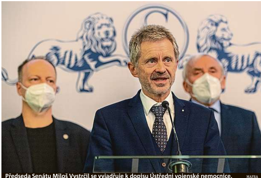
Předseda Senátu Miloš Vystrčil se vyjadřuje k dopisu Ústřední vojenské nemocnice.

K využití článku 66 ústavy je přitom nutný souhlas prosté většiny obou komor parlamentu. SIM, ČTK a iDNES.cz