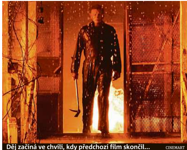
Děj začíná ve chvíli, kdy předchozí film skončil...

„První film byl hodně komorní, líčil dobrovolnou izolaci ženy, která přežila traumatický zážitek a snažila se s ním vypořádat. V pokračo-