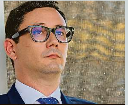
Mluvčí prezidenta Jiří Ovocáček