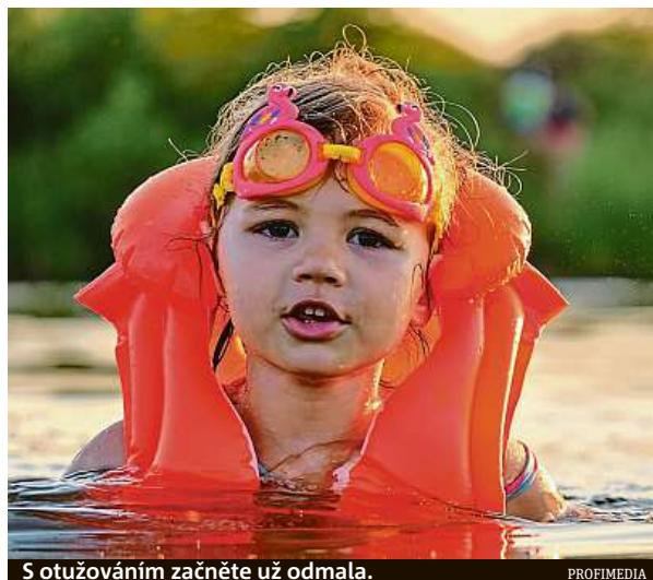
S otužováním začněte už od mala.

Suchý vzduch v místnosti dokáže opravdu potrápít. A přitom stačí tak málo. Mokřý ručník na topení. Určitě nezapomeňte ručník řádně vyvětrat ve vodě, ať vypařování nedostáváte do vzduchu