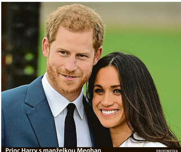
Princ Harry s manželkou Meghan

Deník New York Times přinesl zprávu, že Harry a Meghan nastupují do investičního fondu Ethic, kde mají zastávat roli takzvaných impact partnerů. „To znamená, že budou mít za úkol zvyšovat povědomí o problémech, jako jsou klimatické změny nebo rasová a příjmová nerovnost,“ uvedl spoluzakladatel