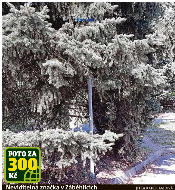
Neviditelná značka v Záběhlicích