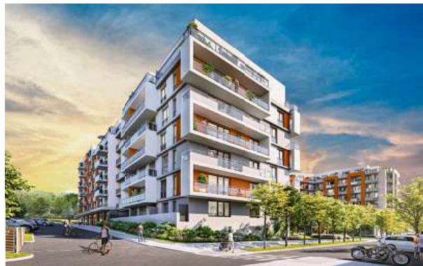
Projekt leží v těsné blízkosti největšího pražského přírodního koupaliště a jen kousek od metra Háje

Největší český rezidenční stavitel Central Group dává pro velký zájem do prodeje dalších 57 bytů v již druhé etapě projektu U Hostivařské přehradě. Celkem v osmi energeticky velmi úsporných bytových domech vyroste 287 moderních bytů 1+kk až 4+kk. Kromě bohaté zeleně tu vznikne i nová mateřská škola, dětské hřiště a restaurace. Velkou výhodou projektu je jeho poloha – jen kousek od metra Háje, poblíž přehradě a lesoparku Hostivař.