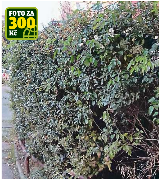
Značka v Pivcové ulici. Opravdu tam je. Najdete ji? O. FLEGEROVÁ