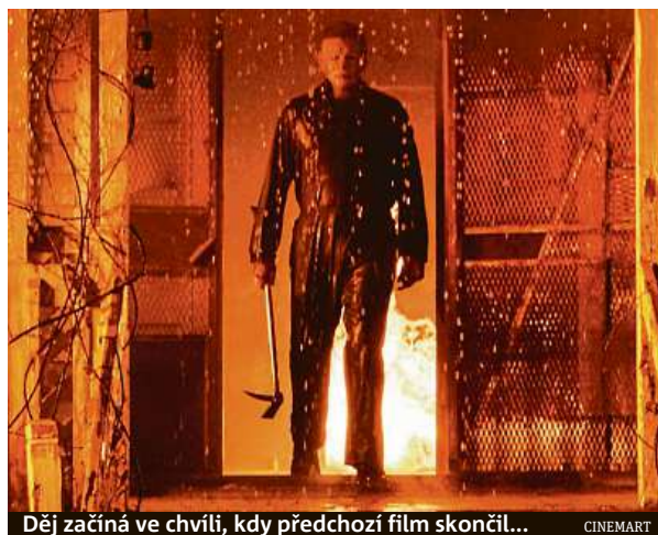
Děj začíná ve chvíli, kdy předchozí film skončil...

„První film byl hodně komorní, líčil dobrovolnou izolaci ženy, která přežila traumatický zážitek a snažila se s ním vypořádat. V pokračo-