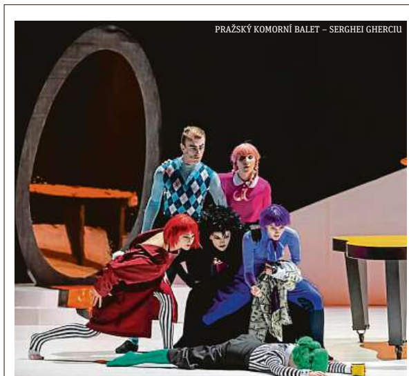
PRAŽSKÝ KOMORNÍ BALET – SERGHEI GHERCIU

Na území Prahy je asi dvacítky záhytných parkovišť a provozuje je městská firma Technická správa komunikací. Vedení města od srpna 2021 zvedlo cenu stání na většině záhytných parkovišť. Na čtyřech budou lidé za denní stání platit 100 korun a na devíti 50 korun. Zbylých sedm, která nejsou hlídána, jsou na 12 hodin zdarma. Dosud řidiči na všech parkovištích kromě jednoho za den zaplatili 20 korun. ČTK