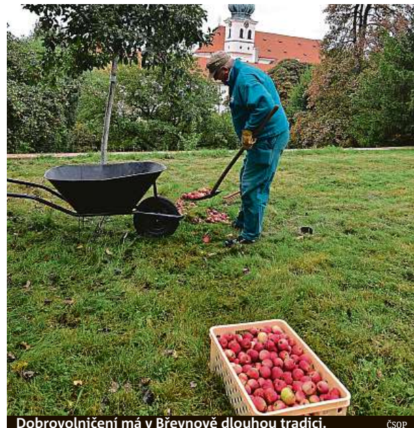
Dobrovolnění má v Břevnově dlouhou tradici.

Každý ovocný strom v areálu kláštera je opatřen etiketou s číslem stromu, názvem odrůdy a QR kódem, jehož prostřednictvím lze načíst podrobnější informace o odrůdě přímo z webu stareodrudy.cz. Zájemci tak mají možnost se s pomocí svého mobilního telefonu dozvědět zajímavosti k odrůdám, o které pečují, přímo na místě, u konkrétního stromu. „Letos zde ještě v rámci péče o genofondový sad plánujeme