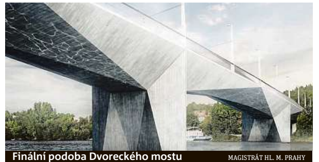
Finální podoba Dvoreckého mostu

Magistrát nedávno v tendru vybral firmu Skanska, která postaví lávku mezi Holešovicemi a Karlínem přes ostrov Štvanice. Oba břehy by měl spojit i nový Rohanský most, o jeho stavbě nicméně magistrát zatím nerozhodl. Mnohé mosty přes Vltavu jsou ve špatném stavu a město je postupně opravuje. ČTK