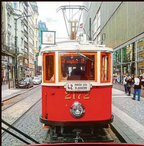
Místo činu: Spálená ulice. Pachatel: @tramdriver747 , který se z přídě své tramvaje pochlubil: „Právě teď jsem dojel tuto krasavici.“ #tramdriver #tram #iamdriver #mojemetro #city #cestajecil #ringhoffer #prague #pragu tram #nostalgie #retro #retrotram #narodnitrida