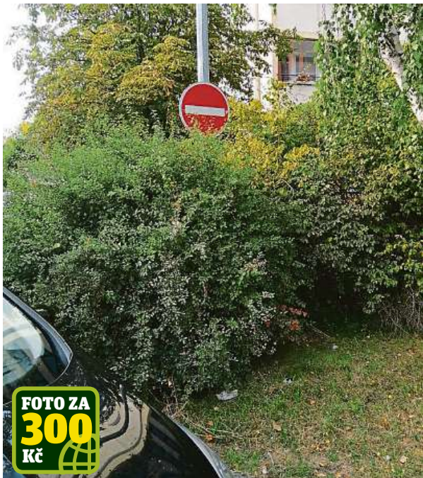
Výjezd z Jílovské ulice v Praze 4