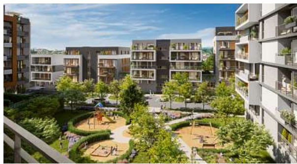
Kromě bohaté zeleně vznikne v lokalitě i nová mateřská škola, dětské hřiště a restaurace

kou a zooparkem. Milovníci cyklistiky ocení mnoho cyklostezek. Další možnosti sportovního využití nabízí blízká fitness centra, squashová hala, rugbyový či fotbalový klub.