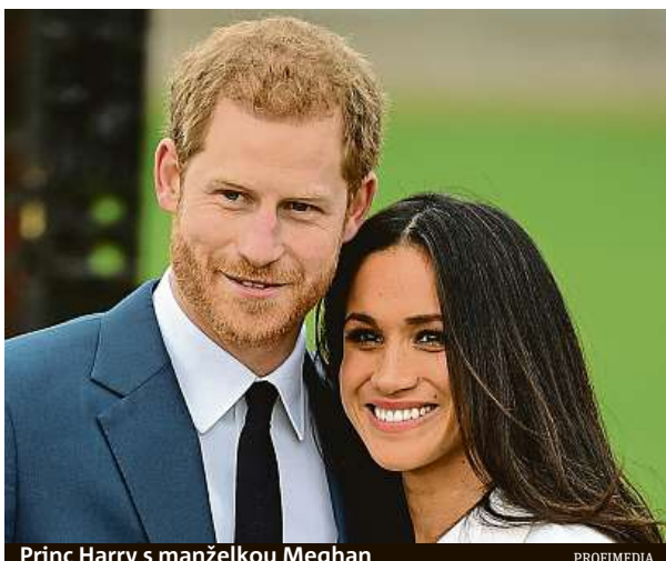
Princ Harry s manželkou Meghan

Deník New York Times přinesl zprávu, že Harry a Meghan nastupují do investičního fondu Ethic, kde mají zastávat roli takzvaných impact partnerů. „To znamená, že budou mít za úkol zvyšovat povědomí o problémech, jako jsou klimatické změny nebo rasová a příjmová nerovnost,“ uvedl spoluzakladatel