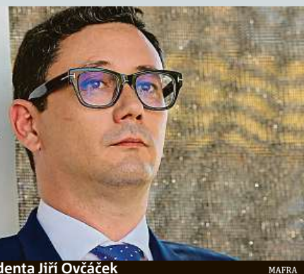
Mluvčí prezidenta Jiří Ovocáček