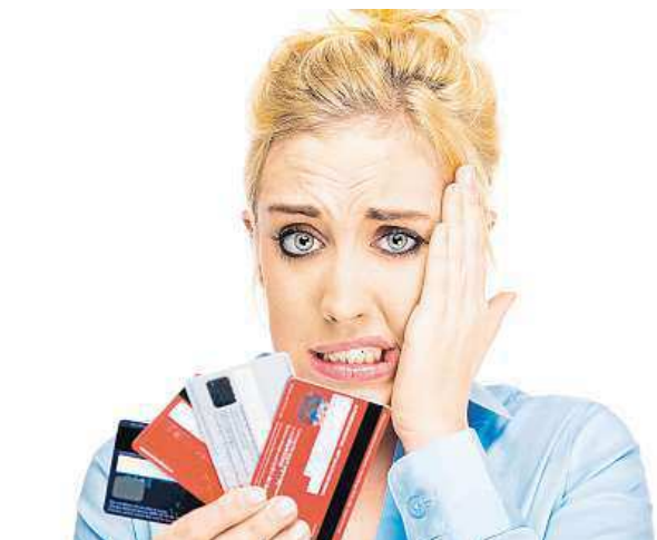
Odložení platby využívá víc jak polovina Čechů.

Dotazník také mapoval preference Čechů v oblasti nakupování na internetu. Nejpreferovanější platební metodou je stále dobírka, kterou přednostně volí skoro 44 % dotázaných. Alespoň jednou měsíc-