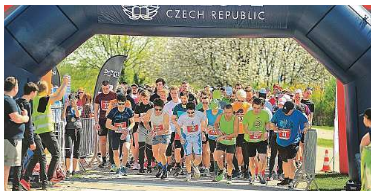
Organizace pořádá jarní a podzimní běhy v pražském parku Ladronka. Na fotce je vidět start závodu jarních běhů.