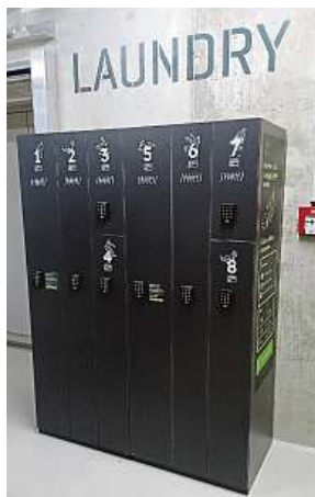
Nestiháte práť doma? Uložte do skříňky a za 24 hodin je hotovo.