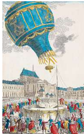
Horkovzdušný balon se zviřaty u zámku Versailles

Historicky první doložený let s lidskou posádkou na palubě se odehrál je pár měsíců poté. Místo hospodářských zvířat se tentokrát pro změnu od země odpoutali