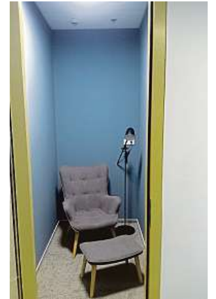
Trucovna? Samotka? Ne, jen místo, kde neruší hovor kolegů.

bují nárokům firem, jež potřebují nové lidi a kvůli jejich nedostatku na trhu práce už jen se stravenkami a služebním mobilem nevystačí.