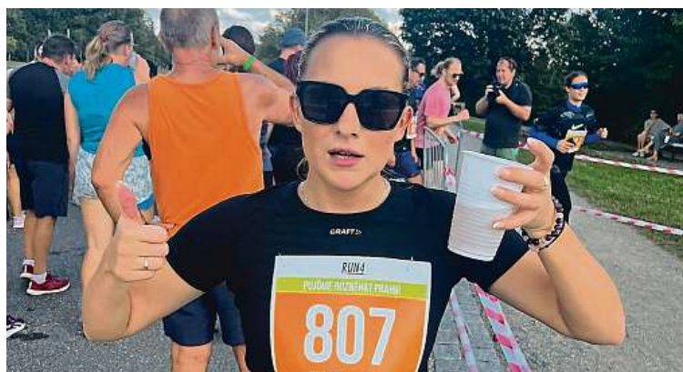
Pivní běhy spojují lásku k běhu i pivo. Jde tak o skvělý způsob, jak strávit společnou aktivitu s přáteli venku.