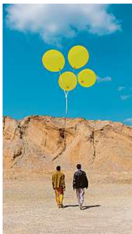
Motiv žluté z obalu desky se prolne i s turné.