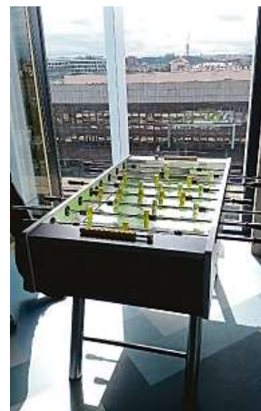
Fotbálek s výhledem na vlaky? Ideální firma pro šotouše.

Tolik pater mají nejvyšší kancelářské budovy v Česku. Obě jsou v Praze na Pancrácích. Současné jsou nejvyššími kancelářskými objekty u nás. City Tower měří v nejvyšším bodě 116 metrů, City Empiria je ještě o 15 metrů vyšší (131 metrů). Pokud dovolí počasí, je z těchto budov vidět na Sněžku v Krkonoších i na Alpy.