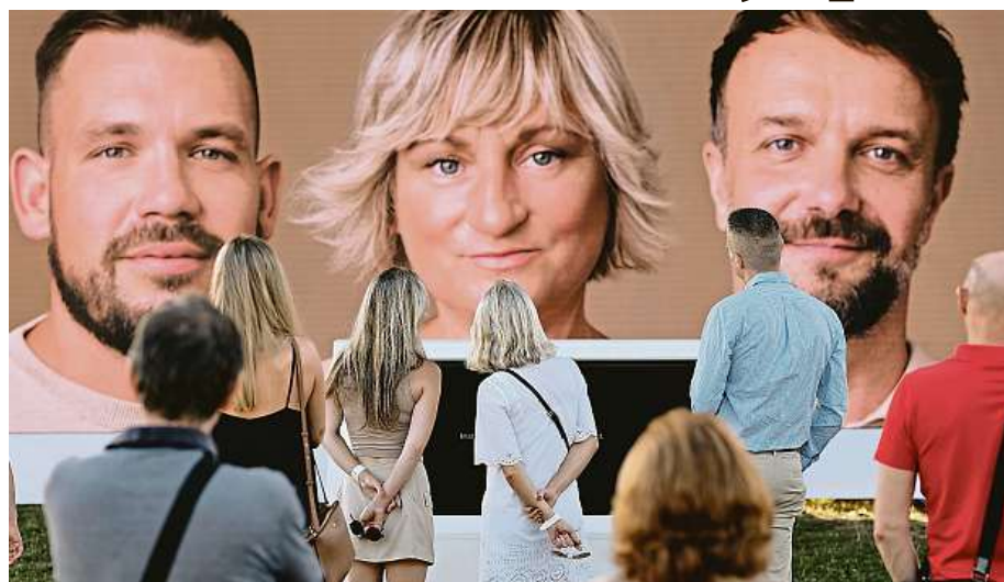
Jedni z 500 tisíc bývalých kuřáků, kteří cigarety vyměnili za lepší alternativu v podobě bezdýmých produktů.

Festák zaostřený na změnu Festival nabídl spoustu zábavy i poznání. Představena byla také nová interaktivní audiovizuální instalace společnosti Philip Morris ČR, jejíž součástí se mohl stát každý návštěvník starší osmnácti let, a měl tak jedinečnou