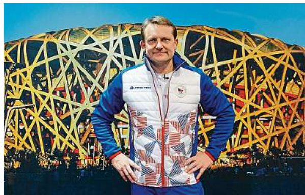
Bývalý rychlostní kanoista Martin Doktor je sportovním ředitelem Českého olympijského výboru a šéfem olympijských výprav.

Doktor nejraději vzpomíná na začátky svého vysokoškolského studia. „První dva roky jsem zažíval skutečný studentský život. Škola, trénink, koleje, cesty po Praze tramvají