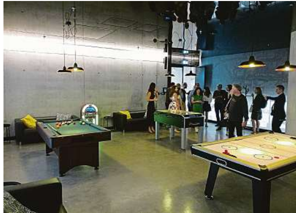
Vstup do zábavního klubu je pro všechny zdarma. Lze tu relaxovat během pracovní doby nebo si uspořádat „mejdan“ po práci.

Jinak už je v kancelářských prostorách 21. století v podstatě vše, co hlavně mladí zaměstnanci vyžadují. Architekti i provozovatelé se přizpůsobují