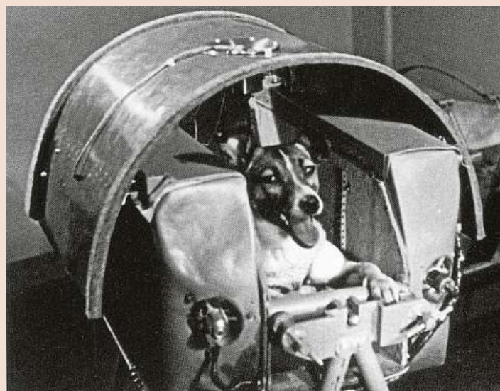
Lajka byla první, ale rozhodně ne poslední. Do historického letu Jurije Gagarina bylo na oběžnou dráhu vypuštěno ještě minimálně deset psů.