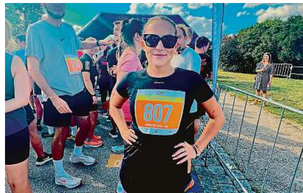
Na každé ze čtyř zastávek museli běžci vypít malé pivo. Páté na ně čekalo po doběhnutí v cíli.

skou euforii. Organizátoři mi na startovní číslo malují čárku, aby věděli, že jsem pivo opravdu vypila, a běžím dál. Na druhé části okruhu je poněkud větší teplo, jelikož zde není stín a alkohol v krvi začínám pocítovat. Mísí se ve mně adrenalin s chtcím překonat sama sebe, a tak zabírám ještě víc. Předbílám pár běžců a běžekyní, kteří po prvním pivu závod vyměnili za příjemnou procházku v příro-