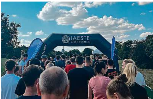
Organizace Run4Ladronka pořádala oficiálně první závod s názvem pivní běhy. 3x METRO

Dohromady jde o dva okruhy, které se v cíli i na startu protínají. Lokace závodu, park Ladronka, je příjemným