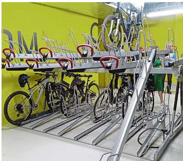
Kolárna s nářadím a myčkou kol už je v moderních kancelářských komplexech stejně samozřejmá jako dobíječky elektroaut.

Co velká část mladých zaměstnanců ale nebere úplně pozitivně, je hledání rovnováhy ve firmách mezi flexibilitou zaměstnanců a potřebou zachovat osobní kontakt mezi lidmi v týmu. „Firmy se nejčastěji obávají ztráty efektivity zaměstnanců, pro manažery je náročnější řídit týmy na dálku a komplikuje se komunikace,“ uvádí Halbrštát. U většiny kancelářských profesí není důvod pro alespoň částečný home office. Ideální je ale nastavit přesná interní pravidla pro jeho využívání. PAVEL HRABICA