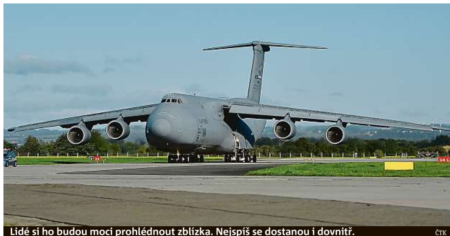
Lidé si ho budou moci prohlédnout zblízka. Nejspíš se dostanou i dovnitř.

Apache či 345 vojáků. Může je přenést na vzdálenost přes 9000 kilometrů. Letoun je nejmodernější verzí největšího amerického letounu pro těžkou mezikontinentální leteckou přepravu. Do Mošnova přepravil americké vrtulníky AH-1Z Viper a UH-1Y Venom, které budou pro návštěvníky akce zajímavé i tím, že v českém letectvu nahradí dosluhující vrtulníky Mi-24/35. Obr do Mošnova letěl 11 hodin. Základnu má v San Antoniu v Texasu. Domluvit účast letounu na akci v Česku bylo náročné a například jeho letová hodina vyjde na několik desítek tisíc dolarů. ČTK