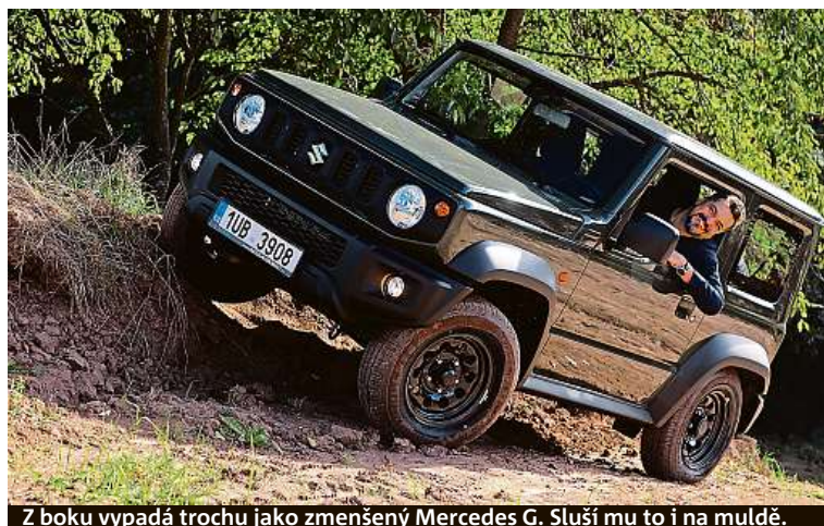
Z boku vypadá trochu jako zmenšený Mercedes G. Sluší mu to i na muldě.

kem 3645 mm), o 45 mm širší a má světlou výšku o centimetr vyšší, nově 210 mm. Auto působí jako veselá krabíčka s kulatými světly. Litá kola mají průměr 15 palců. Kufřík má jen 85 litrů, se sklopenými sedáčkami 377. Původní třináctistovku střídá čtyřválec o objemu 1,5 litru, který má 102 koní. Na výběr je verze s manuálem a automatem, ceny začínají na 423 tisících. PETR HOLEČEK