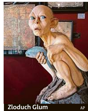
Zloduch Glum

Televizní seriál na motivy románu Pán prstenů britského spisovatele J. R. R. Tolkiena se bude natáčet na Novém Zélandu, kde vznikla i stejnojmenná úspěšná filmová trilogie režiséra Petera Jacksona. Světová televizní práva na Tolkienův fantasy příběh ze Středozezemě koupila před dvěma lety americká společnost Amazon. Očekává se, že půjde o nejdražší televizní pořad všech dob, jehož cena dosáhne nejméně miliardy dolarů (23,4 miliardy korun). Děj nového seriálu by měl předcházet událostem z prvního dílu trilogie Pán prstenů, tedy Společnosti Prstenu.