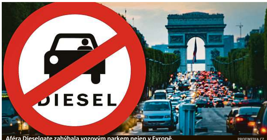
Aféra Dieselgate zahýbala vozovým parkem nejen v Evropě.

Aféra Dieselgate před čtyřmi lety odhalila u některých evropských automobilek v čele s Volkswagenem používání podvodného softwaru při laboratorním měření emisí oxidů dusíku. Ukázalo se také, že výsledky doposud používaných testů NEDC neodpovídají skutečnosti. Diesellová auta, která v laboratoři vy-