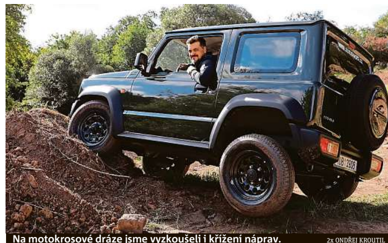
Na motokrosové dráze jsme vyzkoušeli i křížení náprav.