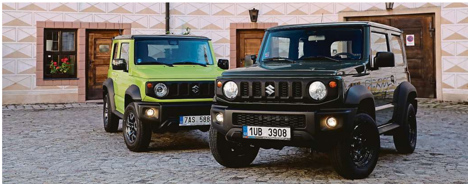
Drží krok s dobou. Ve výbavě je nově systém nouzového brzdění, hlídání jízdního pruhu, čtení značek nebo automatika přepínání světel.