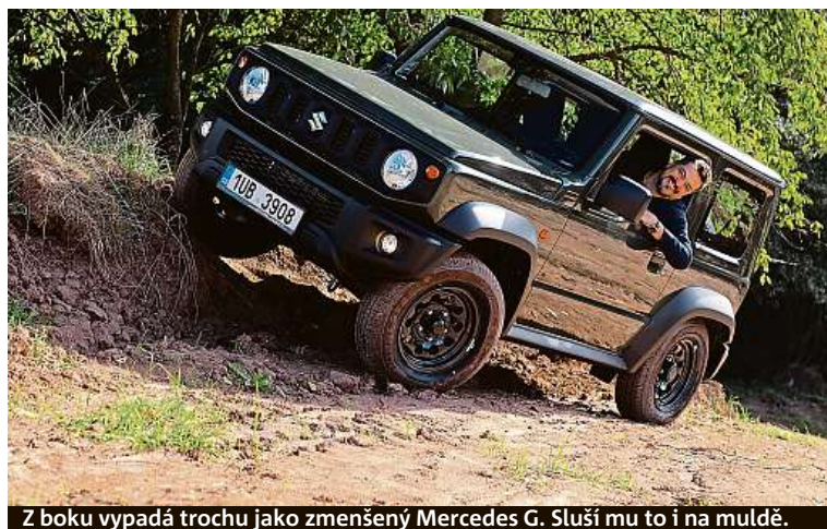
Z boku vypadá trochu jako zmenšený Mercedes G. Sluší mu to i na muldě.

kem 3645 mm), o 45 mm širší a má světlou výšku o centimetr vyšší, nově 210 mm. Auto působí jako veselá krabíčka s kulatými světly. Litá kola mají průměr 15 palců. Kufřík má jen 85 litrů, se sklopenými sedáčkami 377. Původní třináctistovku střídá čtyřválec o objemu 1,5 litru, který má 102 koní. Na výběr je verze s manuálem a automatem, ceny začínají na 423 tisících. PETR HOLEČEK