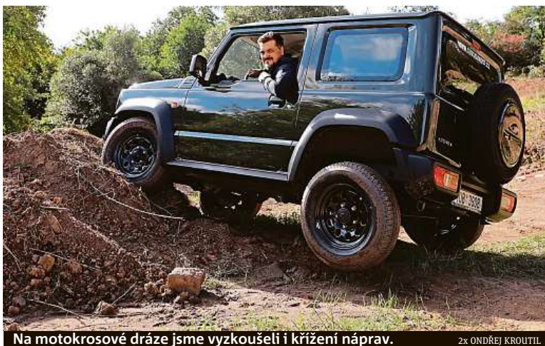
Na motokrosové dráze jsme vyzkoušeli i křížení náprav.