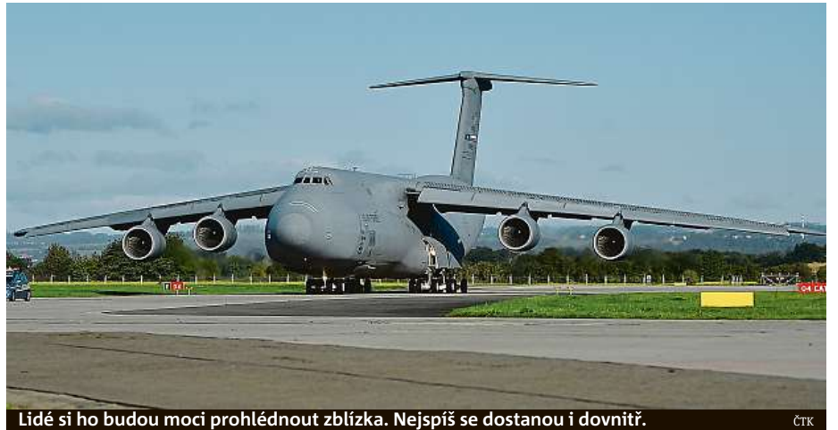
Lidé si ho budou moci prohlédnout zblízka. Nejspíš se dostanou i dovnitř.

Apache či 345 vojáků. Může je přenést na vzdálenost přes 9000 kilometrů. Letoun je nejmodernější verzí největšího amerického letounu pro těžkou mezikontinentální leteckou přepravu. Do Mošnova přepravil americké vrtulníky AH-1Z Viper a UH-1Y Venom, které budou pro návštěvníky akce zajímavé i tím, že v českém letectvu nahradí dosluhující vrtulníky Mi-24/35. Obr do Mošnova letěl 11 hodin. Základnu má v San Antoniu v Texasu. Domluvit účast letounu na akci v Česku bylo náročné a například jeho letová hodina vyjde na několik desítek tisíc dolarů. ČTK