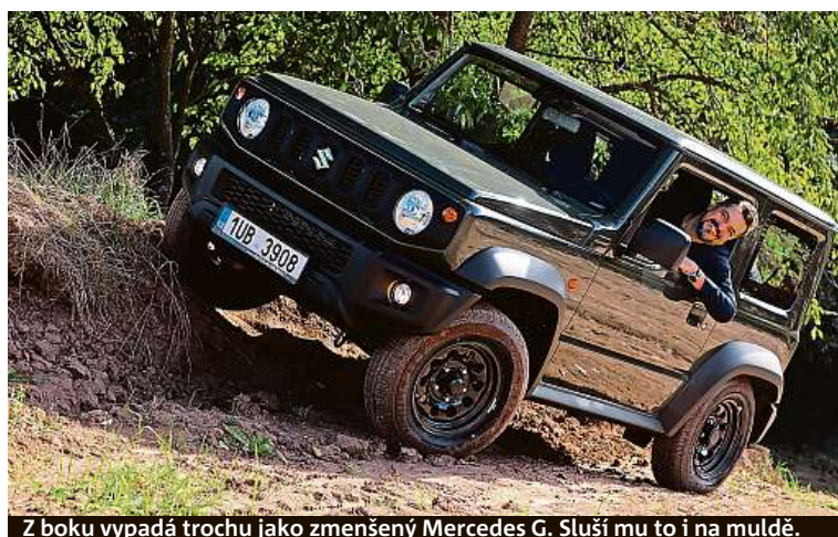
Z boku vypadá trochu jako zmenšený Mercedes G. Sluší mu to i na muldě.

kem 3645 mm), o 45 mm širší a má světlou výšku o centimetr vyšší, nově 210 mm. Auto působí jako veselá krabíčka s kulatými světly. Litá kola mají průměr 15 palců. Kufřík má jen 85 litrů, se sklopenými sedáčkami 377. Původní třináctistovku střídá čtyřválec o objemu 1,5 litru, který má 102 koní. Na výběr je verze s manuálem a automatem, ceny začínají na 423 tisících. PETR HOLEČEK