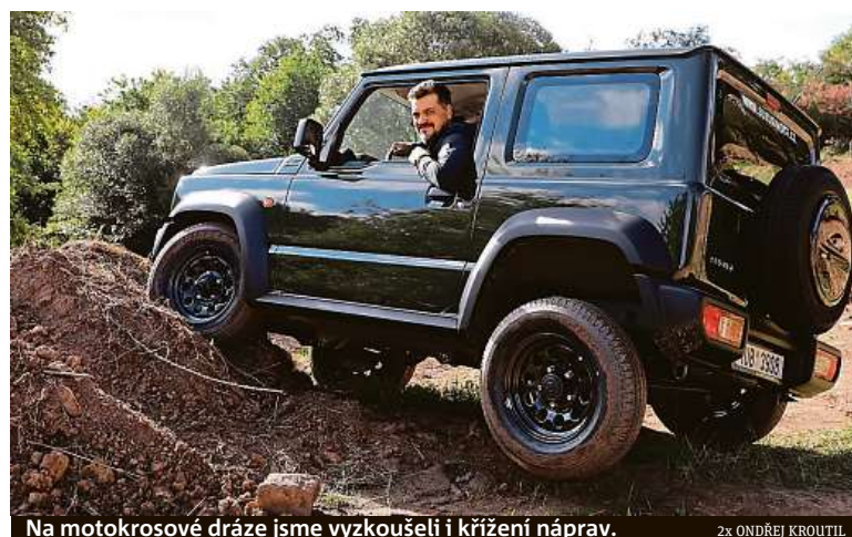
Na motokrosové dráze jsme vyzkoušeli i křížení náprav.