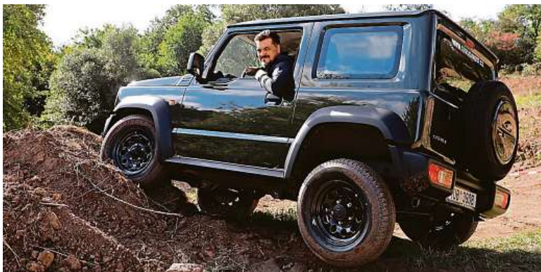
Na motokrosově dráze jsme vyzkoušeli i křížení náprav.