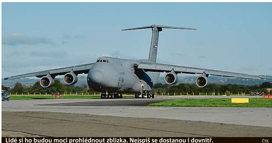
Lidé si ho budou moci prohlédnout zblízka. Nejspíš se dostanou i dovnitř.

Apache či 345 vojáků. Může je přenést na vzdálenost přes 9000 kilometrů. Letoun je nejmodernější verzí největšího amerického letounu pro těžkou mezikontinentální leteckou přepravu. Do Mošnova přepravil americké vrtulníky AH-1Z Viper a UH-1Y Venom, které budou pro návštěvníky akce zajímavé i tím, že v českém letectvu nahradí dosluhující vrtulníky Mi-24/35. Obr do Mošnova letěl 11 hodin. Základnu má v San Antoniu v Texasu. Domluvit účast letounu na akci v Česku bylo náročné a například jeho letová hodina vyjde na několik desítek tisíc dolarů. ČTK