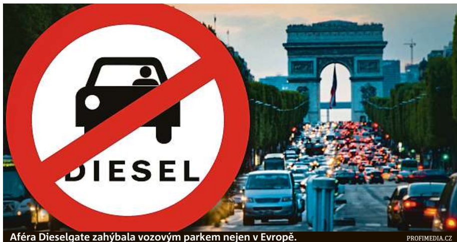
Aféra Dieselgate zahýbala vozovým parkem nejen v Evropě.

Aféra Dieselgate před čtyřmi lety odhalila u některých evropských automobilek v čele s Volkswagenem používání podvodného softwaru při laboratorním měření emisí oxidů dusíku. Ukázalo se také, že výsledky doposud používaných testů NEDC neodpovídají skutečnosti. Diesellová auta, která v laboratoři vy-