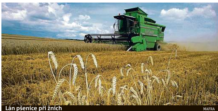
Lán pšenice při žnihu