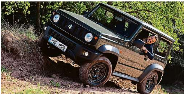
Z boku vypadá trochu jako zmenšený Mercedes G. Sluší mu to i na muldě.

kem 3645 mm), o 45 mm širší a má světlou výšku o centimetr vyšší, nově 210 mm. Auto působí jako veselá krabíčka s kulatými světly. Litá kola mají průměr 15 palců. Kufr má jen 85 litrů, se sklopenými sedačkami 377. Původní třináctistovku střídá čtyřválec o objemu 1,5 litru, který má 102 koní. Na výběr je verze s manuálem a automatem, ceny začínají na 423 tisících. PETR HOLEČEK