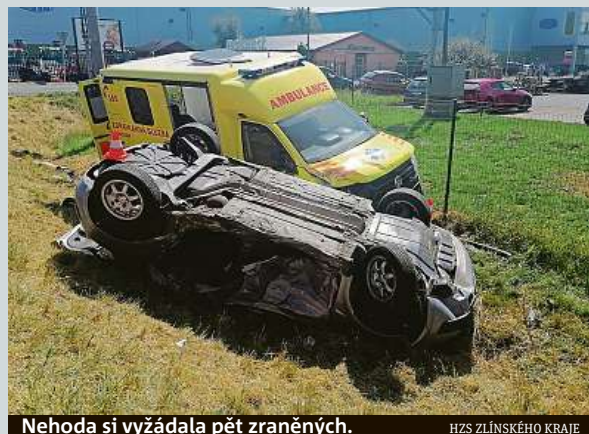
Nehoda si vyžádala pět zraněných.

Končíci ambasador ve Spojených státech amerických Hynek Kmoníček se přesune do Vietnamu. Sdělovalo to ministerstvo zahraničí. Kmoníček je velvyslancem v USA od března 2017, předtím byl čtyři roky ředitelem zahraničního odboru Pražského hradu. Jde o zkušeného diplomata, byl v Austrálii, Asii i v OSN. Při nástupu na velvyslanecký post v USA jednal o návštěvě prezidenta Miloše Zemana u amerického prezidenta