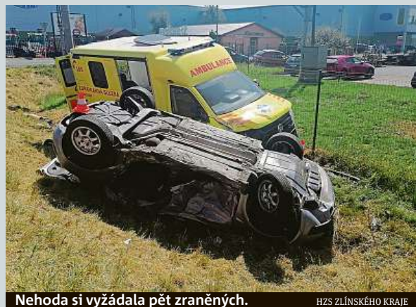
Nehoda si vyžádala pět zraněných. HZS ZLÍNSKÉHO KRAJE

Končící ambasador ve Spojených státech amerických Hynek Kmoníček se přesune do Vietnamu. Sdělení to ministerstvo zahraničí. Kmoníček je velvyslancem v USA od března 2017, předtím byl čtyři roky ředitelem zahraničního odboru Pražského hradu. Jde o zkušeného diplomata, byl v Austrálii, Asii i v OSN. Při nástupu na velvyslanecký post v USA jednal o návštěvě prezidenta Miloše Zemana u amerického prezidenta