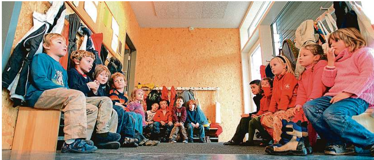
Některé děti by kvůli posunu začátku vyučování musely trávit více času v ranní družině.

Ve stejnou hodinu zahajuje výuku třeba i pražské Gym-