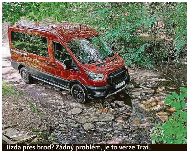
Jízda přes brod? Žádný problém, je to verze Trail.