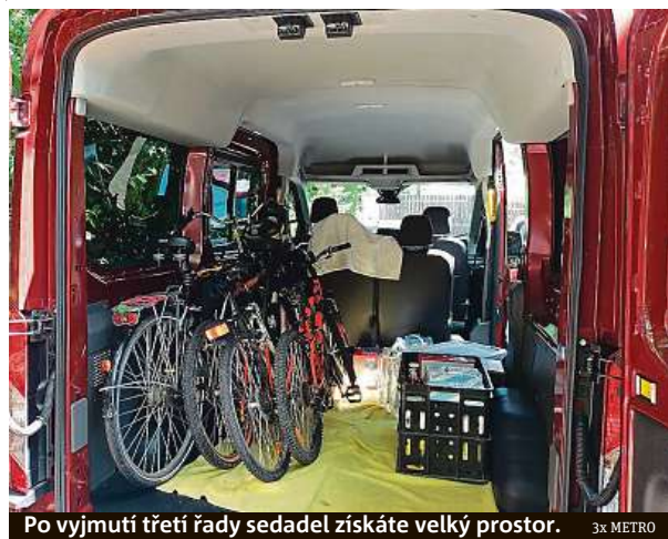
Po vyjmutí třetí řady sedadel získáte velký prostor.