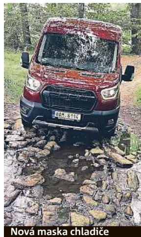
Nová maska chladiče