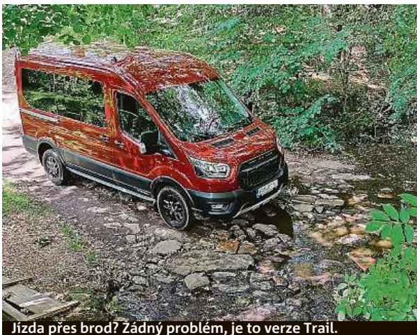
Jízda přes brod? Žádný problém, je to verze Trail.