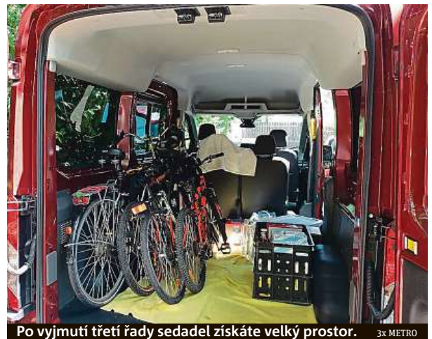
Po vyjmutí třetí řady sedadel získáte velký prostor. 3x METRO