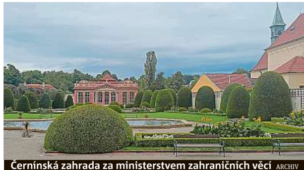
Cernínská zahrada za ministerstvem zahraničních věcí

Velká celodenní dobrodružná hra Pražské věže proběhne v neděli a v pondělí na území historického centra české metropole. Milovníci historie z celé republiky se několikrát za rok sjíždí do Prahy, aby chodili po pražských věžích. Tentokrát k nim však budou vzhlížet z pražských zahrad.