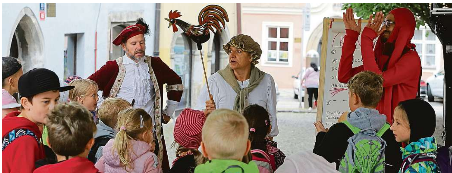
Děti z příměstského tábora poznávají historii chebských náměstí. Uličkami starého města je včera provázely postavy šaška, starosty a kramářky.

Senioři. Mnozí se dosud nenechali očkovat, uvěřili nejrůznějším fámám. Osvěta. Důležité je umět naučit se nesmysly a lži rozpoznávat. Zajímavé zjištění. Lidé nad 60 let méně důvěřují tradičním médiím STRANA 2