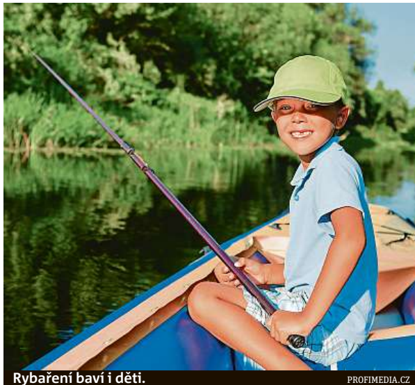
Rybaření baví i děti.

Ve Šternberku na Olomoucku se pro změnu vrací k tradičnějším kroužkům. Děti i rodiče totiž o ně projevi-