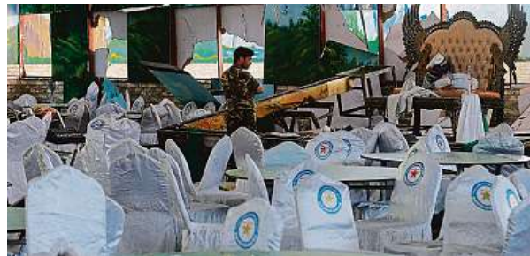
Zničený sál po výbuchu