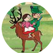
Lukáš Větrník Zajímám se pouze o vzdálenost k nejbližší putyce.