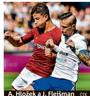
A. Hložek a J. Fleišman ČTK

Fotbalisté Slovácka si v 6. kole Fortuna ligy připsali už čtvrtou výhru.