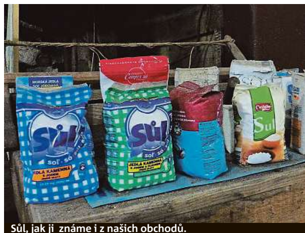
Sůl, jak ji známe i z našich obchodů.