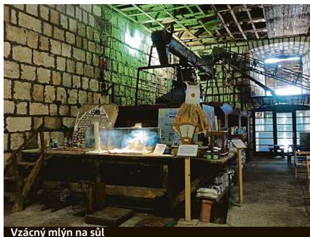
Vzácný mlýn na sůl

domů, hřeje vás pocit, že jste udělali všechno pro vlastní zdraví. Inu, slaný marketing tady skvěle zvládají, vždyť to tady ve 14. století patřilo Benátčanům, a ti byli vyhlášenými evropskými obchodníky. PAVEL HRABICA