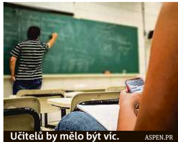
Učitelů by mělo být víc. ASPEN.PR

V českých školách chybí tisíce učitelů. Na vině není jen jejich slabé platové ohodnocení, ale také generační obměna, která se sešla s nástupem silných populačních ročníků dětí.