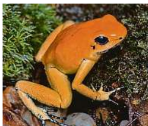
Pralesnička strašná VÍT LUKÁŠ