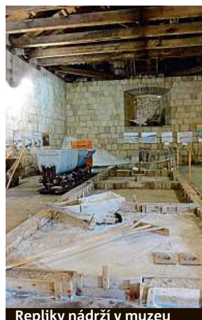
Repliky nádrží v muzeu