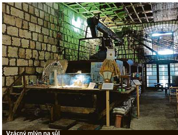
Vzácný mlýn na sůl

domů, hřeje vás pocit, že jste udělali všechno pro vlastní zdraví. Inu, slaný marketing tady skvěle zvládají, vždyť to tady ve 14. století patřilo Benátčanům, a ti byli vyhlášenými evropskými obchodníky. PAVEL HRABICA