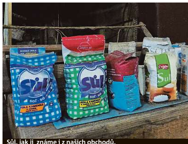
Sůl, jak ji známe i z našich obchodů.