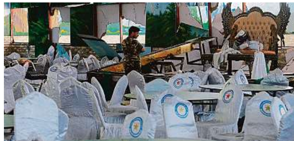
Zničený sál po výbuchu