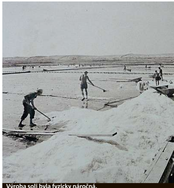
Výroba soli byla fyzicky náročná.

Čechy potěší, že mezi vystavenými baleními soli pro nejrůznější domácí využití, jsou i nepřehlédnutelné modré a zelené kilogramové sáčky, které najdete ve většině našich obchodů. I tahle sůl putuje do českých domácností nebo restaurací z Pagu. Turisté si mohou samozřejmě jako suvenýr zakoupit dárková balení. V nabídce najdete i košer sůl. Chorvatí umějí kvalitu místní soli patřičně vychválit, zdůraznit její naprostou odlišnost a výjimečnost proti solím z jiných částí světa, takže když si malé balení vezete