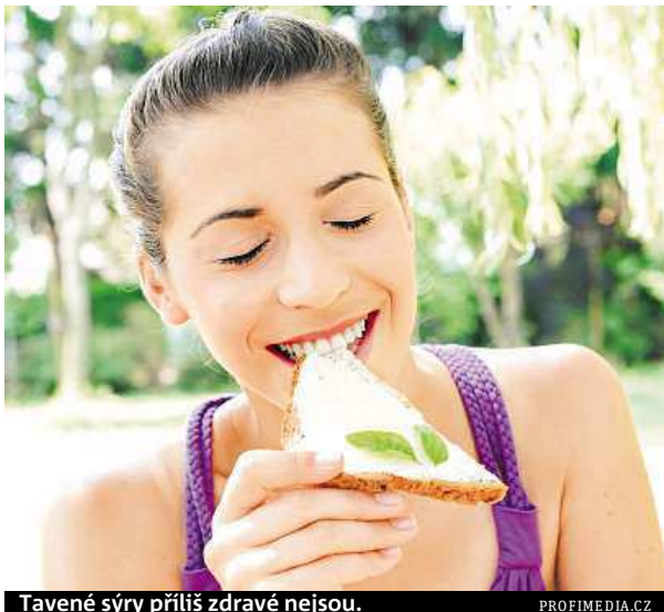
Tavené sýry příliš zdravé nejsou.

Pokud dlouhodobě konzumujeme nevhodná, nekvalitní nebo přímo škodlivá jídla, následky na sebe nenechají dlouho čekat. „Představme