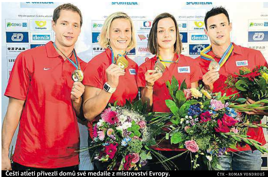
Čeští atleti přivezli domů své medaile z mistrovství Evropy.

Vedle gratulací za to dostala také mnoho kytic. Největší radost jí ale udělala ta, ve které našla i oblíbené gladioly. „Gladioly jsou moc oblíbené. Dokonce je sama pěstuju a mám hezčí na zahradě. Teď už odkvetly, ale když jsem odjížděla, tak byly krásný,“ řekla oštěpařka.