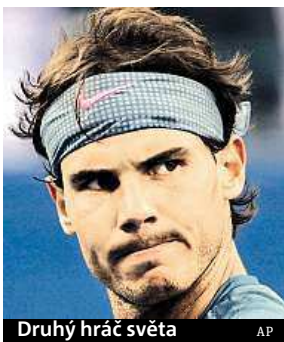
Druhý hráč světa

„Moc mě to mrzí, ale musím oznámit, že přijdu o US Open,“ uvedl osmadvacetiletý Nadal na sociálních sítích. „Už s tím nic neudělám, proto to musím vzít tak, jak to