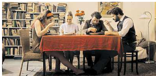
Vítěz z roku 2012 Hlavní chod se promítal v Cannes. YOUTUBE

V roce 2012 se pražský vítězný snímek s názvem Hlavní chod umístil mezi nejlepšími filmy na světě, byl promítnut v Cannes a objevil se na plátnech v tak vzdáleném místě, jako je Albuquerque v Novém Mexiku. čTK