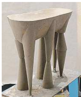
Sochy pro Vítkov: Oltář (vlevo) a (A)symbiont