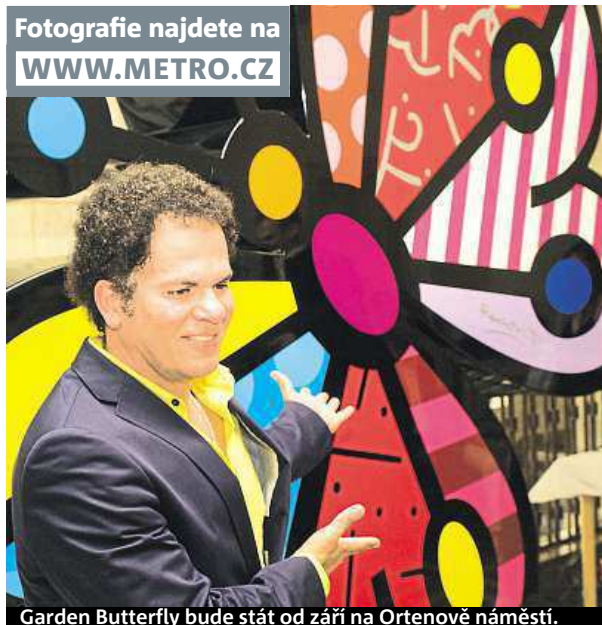
Garden Butterfly bude stát od září na Ortenově náměstí.

Od Klárova po Vysočany: tady letos sochy proměňují lokality v městských částech 1 až 10