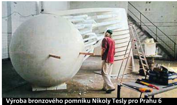
Výroba bronzového pomníku Nikoly Tesly pro Prahu 6

• Praha 7: Novou sochu odhalí na Ortenově náměstí. Jedná se