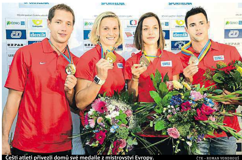
Čeští atleti přivezli domů své medaile z mistrovství Evropy.

Vedle gratulací za to dostala také mnoho kytic. Největší radost jí ale udělala ta, ve které našla i oblíbené gladioly. „Gladioly jsou moc oblíbené. Dokonce je sama pěstuju a mám hezčí na zahradě. Teď už odkvetly, ale když jsem odjížděla, tak byly krásný,“ řekla oštěpařka.