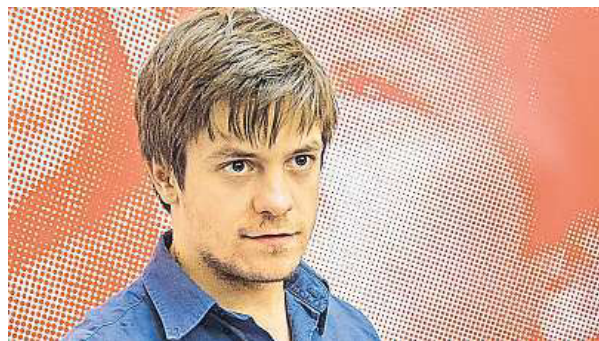
Jedním z porotců letošního ročníku bude Jiří Mádl.