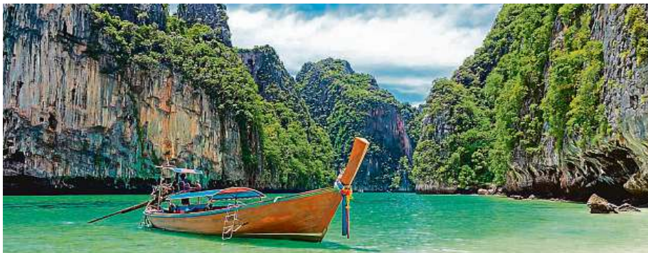
Thajský ostrov Phuket má rozlohu 543 čtverečních kilometrů a nachází se přibližně sedm set kilometrů jižně od thajské metropole Bangkoku. Od prosince sem budou létat spoje i z Brna.

Čedok v spolupráci s italskou leteckou společností Neos odstartuje přímé lety z Brna do Thajska na ostrov Phuket. Premiéru v Tuřanech