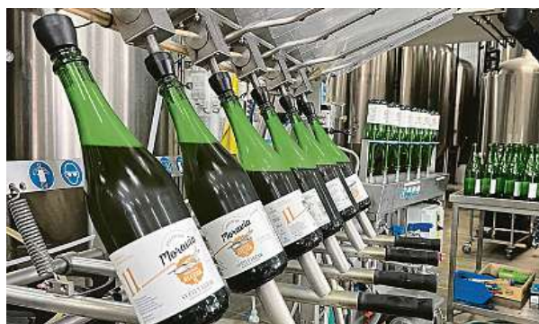
Od období covidu začal pivovar dodávat lahvované speciály i do obchodních řetězců.

Krise způsobená pandemií covidu-19 zasáhla i medlánecký pivovar. Jeho majitelům se díky změně ve strategii podařilo problémový rok překonat a v roce 2021 pivovar do-