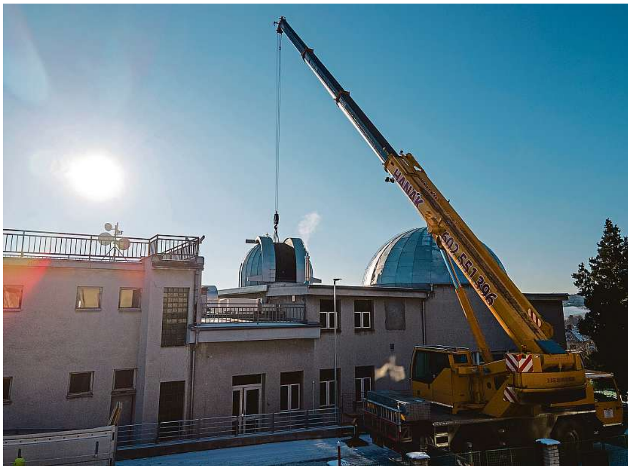
Instalace dalekohledu proběhla již v zimě. Po testovacím režimu byl v červnu uveden do oficiálního provozu.