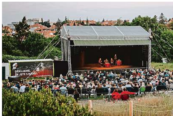
Amfiteátr na Kraví hoře využívá přes prázdniny Divadlo Bolka Polívky.