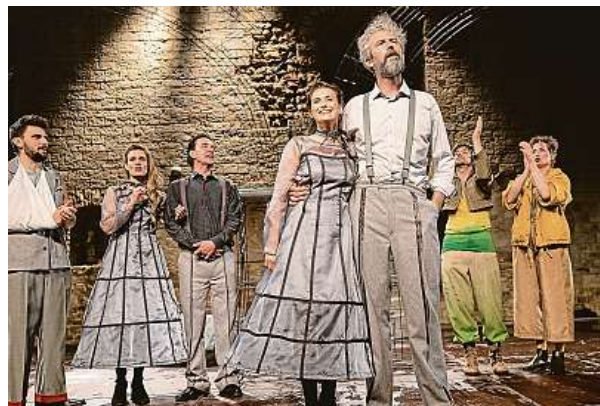
Inscenace Jak se vám líbí se bude hrát na Špilberku v rámci Letních shakespearovských slavností.