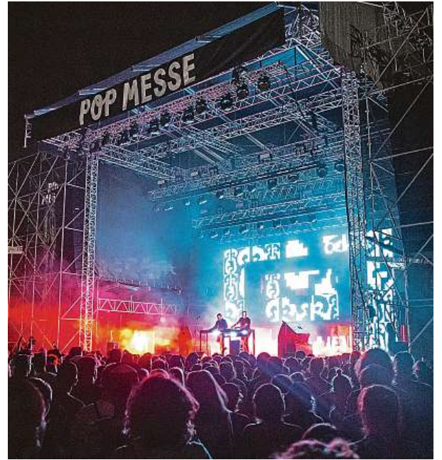
Venkovní scéna festivalu Pop Messe bude znovu u stadionu Za Lužánkami.