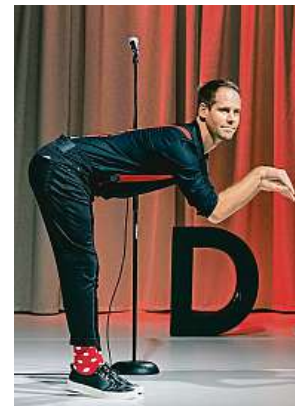
Přijít se podívat můžete také na DADA Revue.