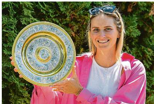
Česká tenistka Markéta Vondroušová si stále užívá pocitu vítězky slavného Wimbledonu.

Zatímco ve Wimbledonu byla nenasazená, od pondělka jí patří v žebříčku desátá příčka. Nikdy v kariéře pozna-