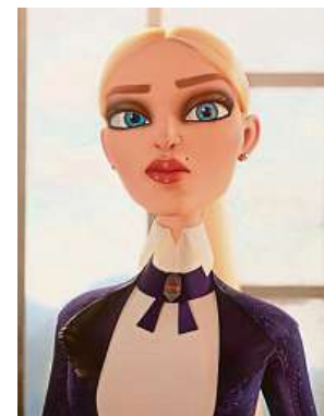
Bezcitná a lakotná Kylina chce být věčně mladá.