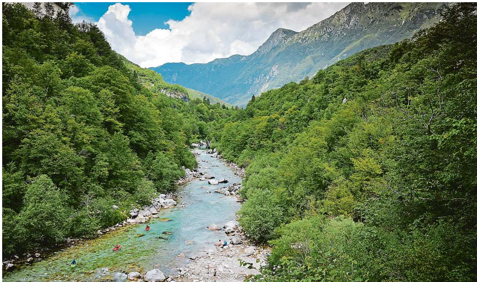
Slovinsko vás uchvátí především svou panenskou přírodou.