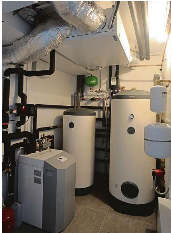
Technické zázemí úsporného rodinného domu s tepelným čerpadlem a rekuperační jednotkou připomíná spíše laboratoř. MAFRA

O tom, že Češi od loňska šetří, někde „jako diví“, svědčí