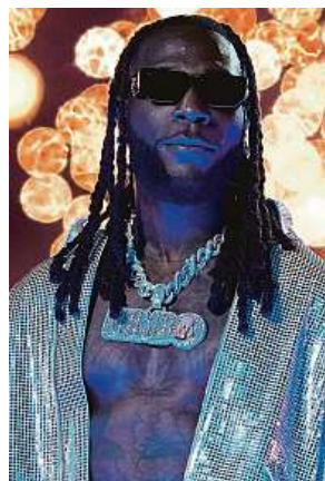
Burna Boy