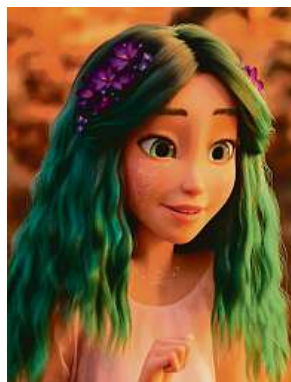
I víla jménem Mavka podlehne kouzlu lásky. 2x CINEMART

Její hlavním posláním je chránit proti jakémukoli zlu i před světem lidí posvátné Srdce lesa, zdroj samotného života. Najdou se však i kverulanti, kteří mají pochybnosti,